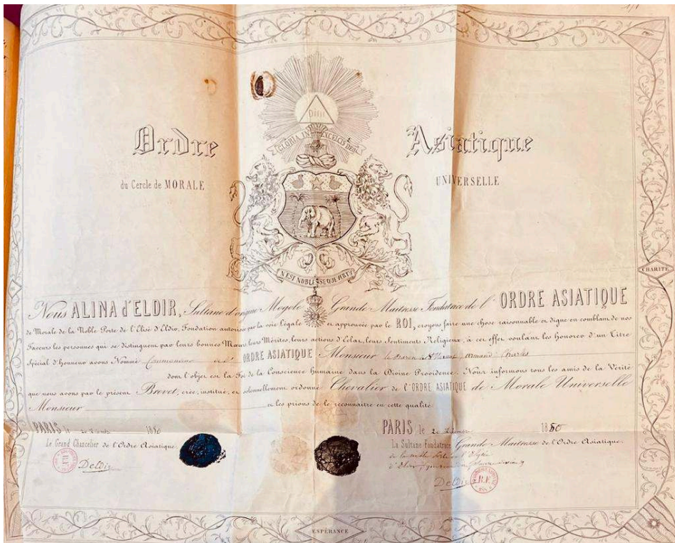
© Bibliothèque nationale de France, Nouvelles Acquisitions françaises, cote 21501, pièce 171