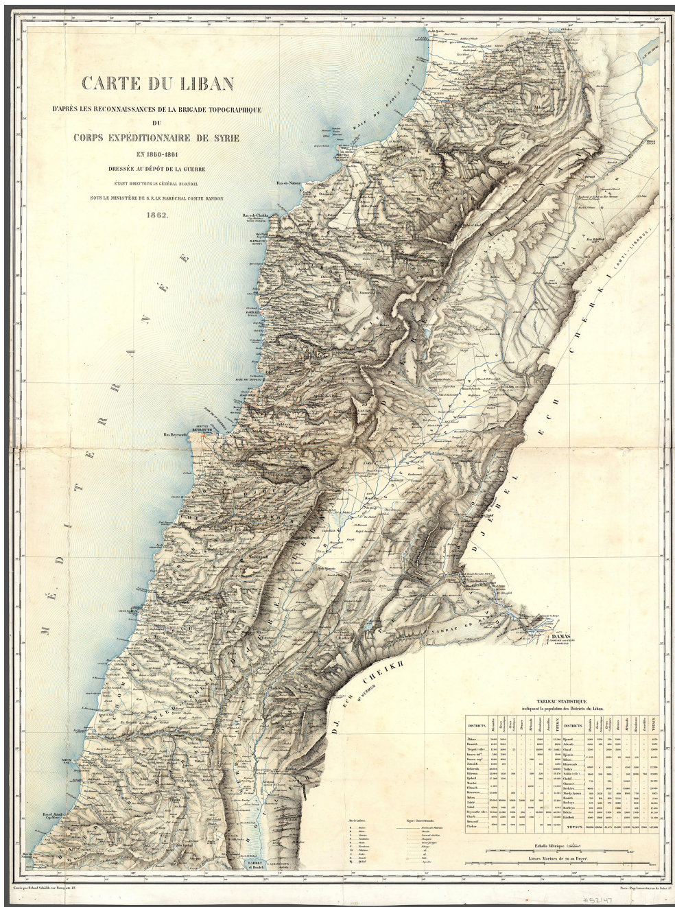
Carte du Liban d'après les reconnaissances de la Brigade Topographique du Corps Expéditionnaire de Syrie en 1860-1861