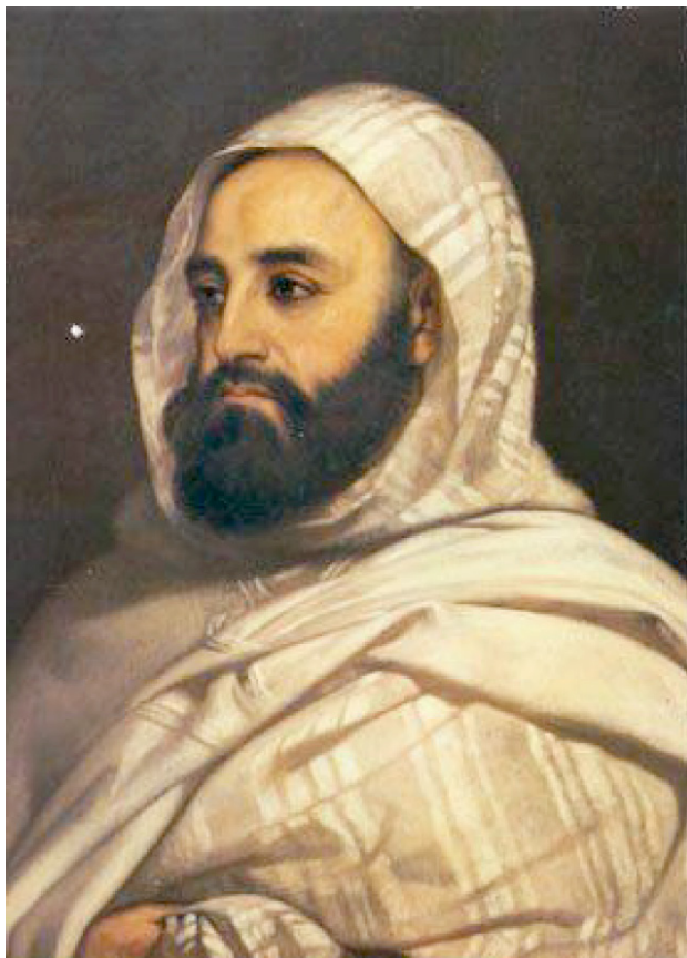
Abd al-Qâdir, carte postale en couleur tirée de la collection du château d'Amboise (correspondance de Wetzstein, Staatsbibliothek, Berlin, NL II, Kasten 5/D, v.15).