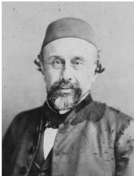
Mehmet Fuat Pasha