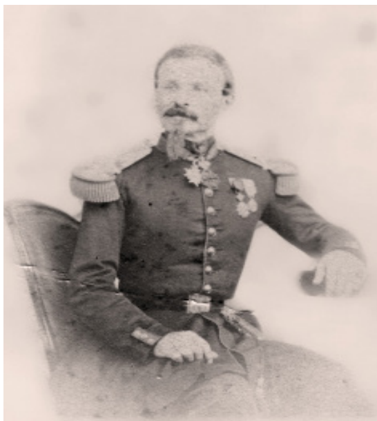
Alfred Chanzy (1823-1883)