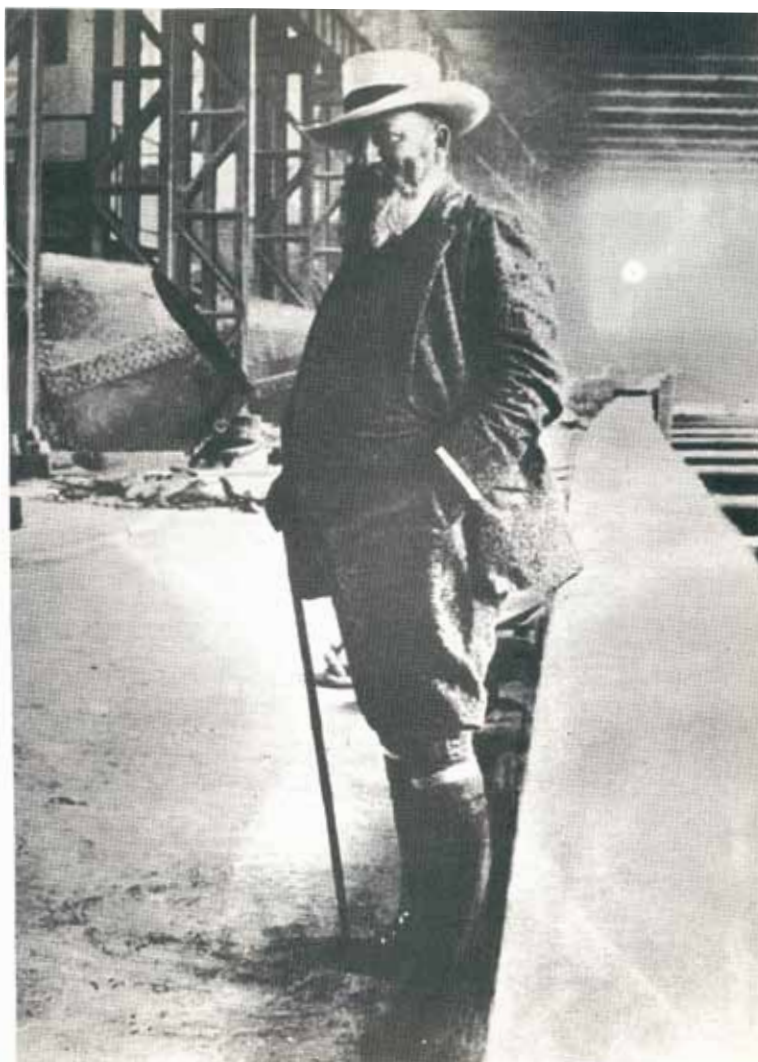
Emile Mayrisch au cœur de l'usine de Dudelange.