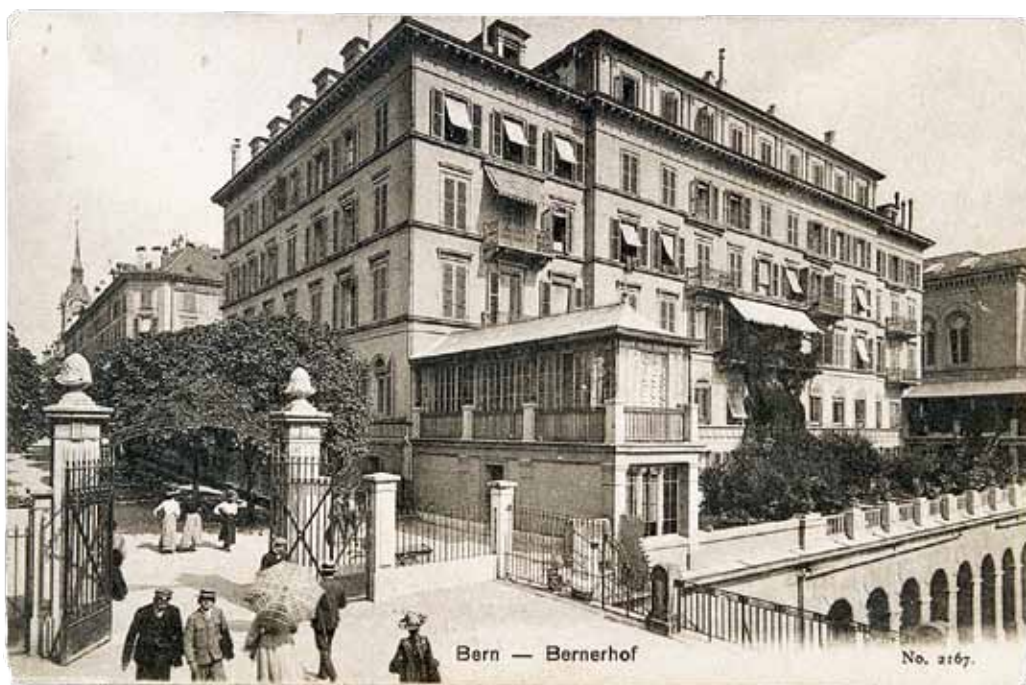
Archives du CDMH, Fonds tourisme, sous-fonds Suisse, carte postale Hôtel Bernerhof à Berne, sans date, vers 1900, sans auteur

moment où Mayrisch demanda ses passeports. L'avantage de Cumont fut qu'une enquête de routine des Allemands pût compter cet intellectuel belge comme un correspondant habituel d'Aline Mayrisch, l'épouse du Dudelangeois, et ne pas prêter attention, ni au contenu laconique, ni à la fréquence des échanges. La mise en place d'une Paßzentrale à Luxembourg, à partir du 15 avril 1916, sans compter les conséquences de l'affaire Noppeney, rendit plus difficile les déplacements vers la Suisse, restriction s'ajoutant aux mesures aléatoires de fermetures de la frontière. Mais elle n'empêcha pas légalement les communications télégraphiques 55 . Dès le 11 mai, Mayrisch adressa à Cumont un message évoquant le nouveau bombardement des usines luxembourgeoises par l'aviation française 56 ... Il fit certainement la même chose un an plus tard. Le 22 mai 1917, Barbanson annonça tou-