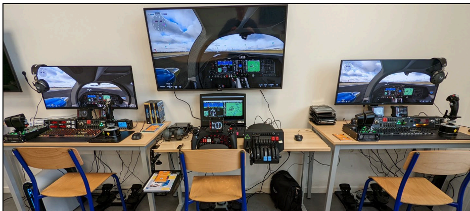
Figure 1. Les trois simulateurs de vol du fablab GamiXlab de l'IAE Paris-Est.

Trois simulateurs de vol sont déployés au GamiXlab dans le cadre d'un projet tuteuré étudiant (Figure 1). Encadré par un enseignant-chercheur détenant le certificat d'aptitude à l'enseignement aéronautique (CAEA 5 ), des expérimentations sont menées depuis 2020 pour concevoir et réaliser des enseignements de management autour des facteurs humains en s'appuyant notamment sur les concepts de Crew Resource Management (CRM 6 ).