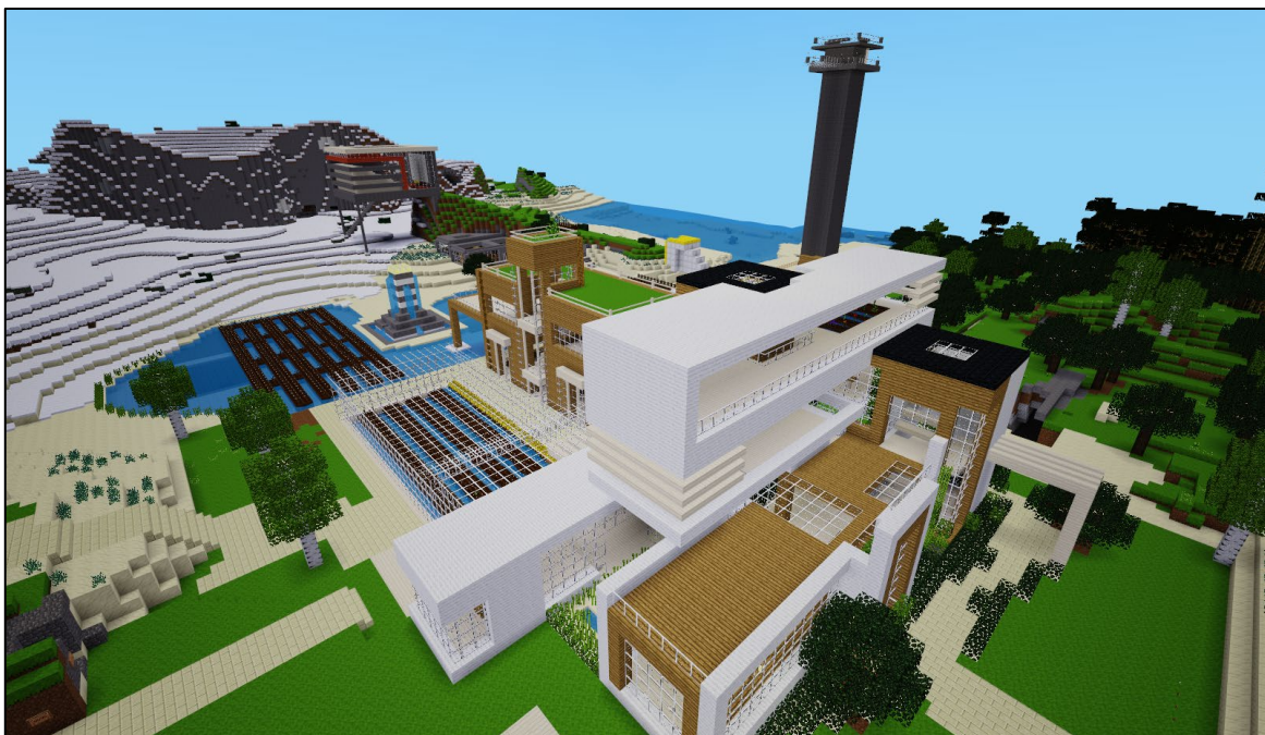
Figure 2. Interface 3D du jeu vidéo Minetest.

Minetest a de nombreux atouts pour des usages pédagogiques. Si sa gratuité est un avantage important, la configuration informatique nécessaire est assez réduite et le jeu fonctionne sur des ordinateurs relativement anciens et ne possédant pas de carte graphique dédiée. De plus, lorsqu'il est utilisé à partir d'un serveur distant, le nombre de participants peut être très élevé. Nous avons mené des tests techniques avec plus de cent-vingt étudiants sans constater la moindre réduction de performance. En revanche, le coût de la location d'un serveur est alors à prendre en compte (environ 1000 euros en 2023), quel que soit le nombre d'étudiants et le temps d'usage.