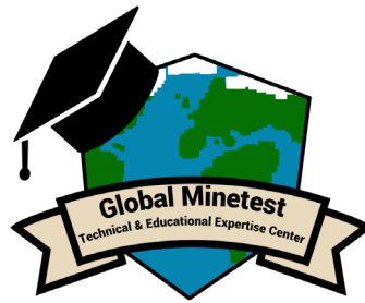
Figure 5. Logo du projet tuteuré Global Minetest Technical & Educational Expertise Center.

Minetest et le système d'information géographique (SIG) QGIS 15 est à l'étude pour proposer ensuite Minetest dans des enseignements de géomatique 16 et de management des SI.