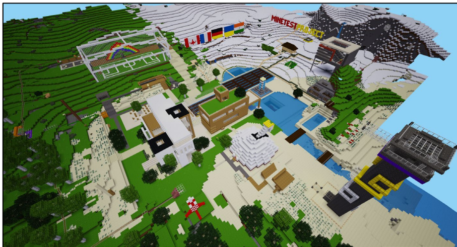
Figure 4. L'université du futur réalisée par trente-six étudiants de cinq nationalités (Allemagne, Canada, France, Inde et Ukraine), soit douze fuseaux horaires.

Minetest est accessible en permanence car il est installé sur un serveur dédié loué. Cette caractéristique permet de réaliser des projets internationaux pouvant potentiellement intégrer des étudiants du monde entier. Nous avons par exemple piloté deux projets avec des enseignants et étudiants de plusieurs pays : Canada, Inde, Allemagne, Pays-Bas et Ukraine. L'ensemble des étudiants (en projets tuteurés) participait à un projet de construction dans l'environnement virtuel commun afin de découvrir les atouts et contraintes d'un projet international et donc multiculturel. Le premier projet (2021) consistait à construire l'université du futur (Figure 4) et le second (2022) à reproduire un quartier d'Amsterdam.