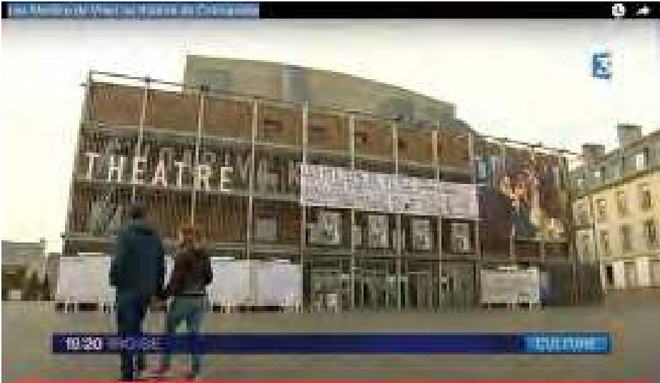
Capture d'écran du journal télévisé 19/20 Iroise sur France 3 Bretagne

voit des panneaux blancs qui servent de supports pour placarder le texte. Les quatre pièces sont ainsi lisibles sur les murs et les abords du théâtre et disponibles à l'entrée de la salle pour chaque spectateur qui le souhaite. Il ne s'agit donc pas d'«en finir» avec Molière, mais plutôt de revenir à la lettre du texte, de repartir de zéro, faisant table rase des vernis déposés sur ces œuvres-monuments pour proposer un partage d'expérience dont le texte se veut le pivot central. Ce que signe le geste artistique de Gwenaël Morin, contre toute attente sans doute, c'est un retour au texte et un retour du texte de théâtre, avec Molière et le répertoire classique pour étendard.