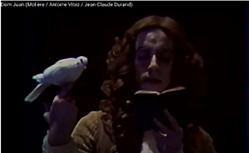
Une image marquante du "Don Juan": la colombe vivante posée sur la main de Don Juan.

Aujourd'hui encore, les spectateurs et spectatrices de l'époque ne cessent de se souvenir de ces Molière comme d'un éblouissement théâtral.