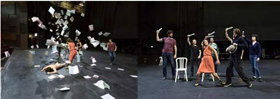
Les Molière de Vitez, Don Juan et Le Misanthrope , crédit photo Sara Ferroud.