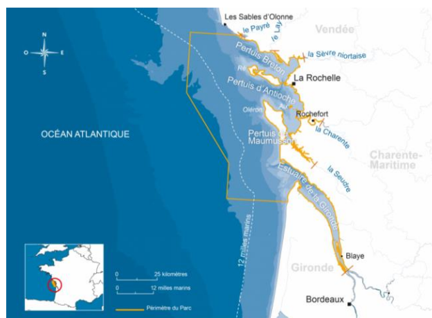
Figure 1 : Périmètre du Parc naturel marin de l'estuaire de la Gironde et de la mer des pertuis.