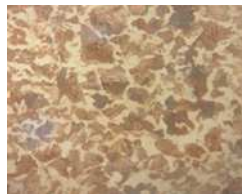
avec 0,80% de carbone

↓ ACIERS DURS, ACIERS TREMPÉS ↓ avec 1,20% de carbone 0,48%C et trempé à l'eau