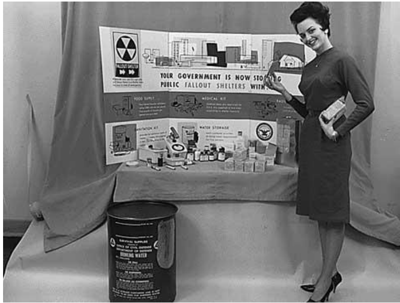
Stand de la défense civile canadienne, dans les années 1960.