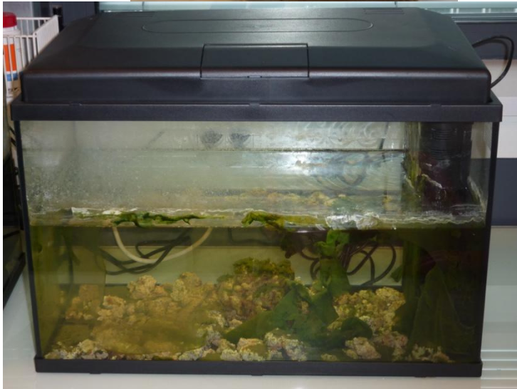
Fig. 7 : Stromatolithe « élevés » en aquarium, « juste après la récolte », Paris, Institut de Minéralogie, Physique des Matériaux et Cosmochimie (IMPMC), 2018 et 2012.