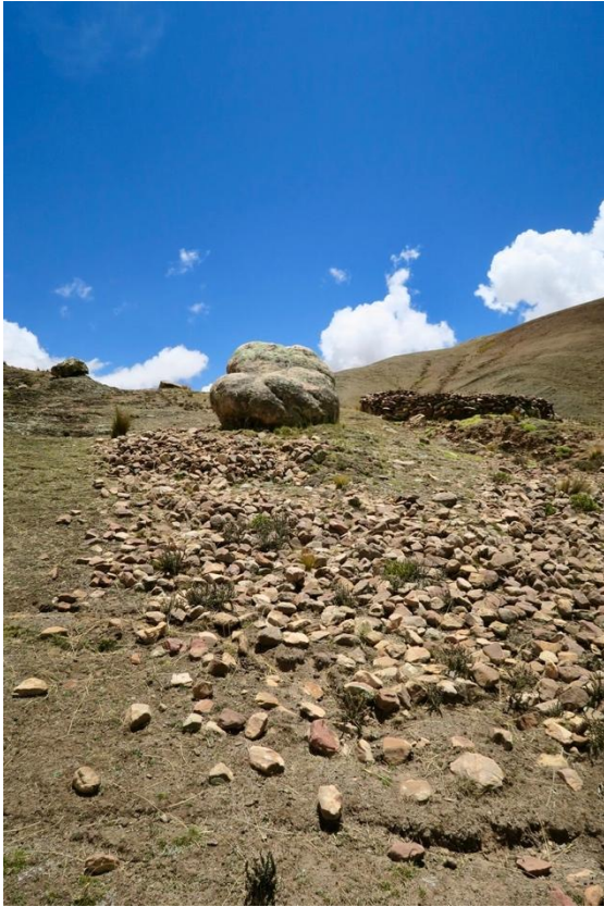
Fig. 5 : Pierre crapaud considérée comme dure et incassable, Nord Potosi (Bolivie), 2017.

Par ailleurs, les pierres sont réputées pouvoir se déplacer sans l'intervention d'un être humain. Les pierres sont plus anciennes que le soleil et leur animation dépend du cycle lunaire. Chaque pleine lune par exemple, les pierres recouvrent leur mobilité présolaire : la pierre crapaud croasse et saute, les pierres colibri volent, d'autres marchent à la rencontre de leurs partenaires. Cette mobilité est loin d'être chaotique. Comme le dit un berger du Nord-Potosi, « les humains se perdent mais les pierres non ». Il signifie par-là que, contrairement aux êtres humains qui migrent, les pierres reviennent toujours « là où elles habitent ». Dès lors, ce qui fait que l'on peut localiser les pierres, ce n'est pas leur immobilisme mais leur retour obstiné au même endroit.