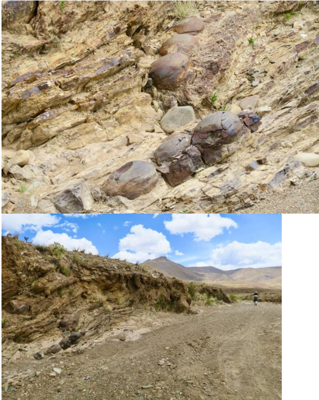
Fig. 3 : « Pierres colibri » présumées voler de sommet en sommet et connues pour résister à la force des courants, Nord-Potosi (Bolivie, nov. 2017).

En définitive, dans les Andes, les pierres sont dotées d'une vie sociale riche : elles nouent des liens avec des êtres humains, avec des forces telluriques (le vent, la foudre), des animaux d'élevage (taureaux, lamas) et sauvages (mouffette, crapaud, souris), avec des montagnes et d'autres pierres. Appréhender les pierres dans un écosystème de relations qui ne soit pas exclusivement humain est donc indispensable.