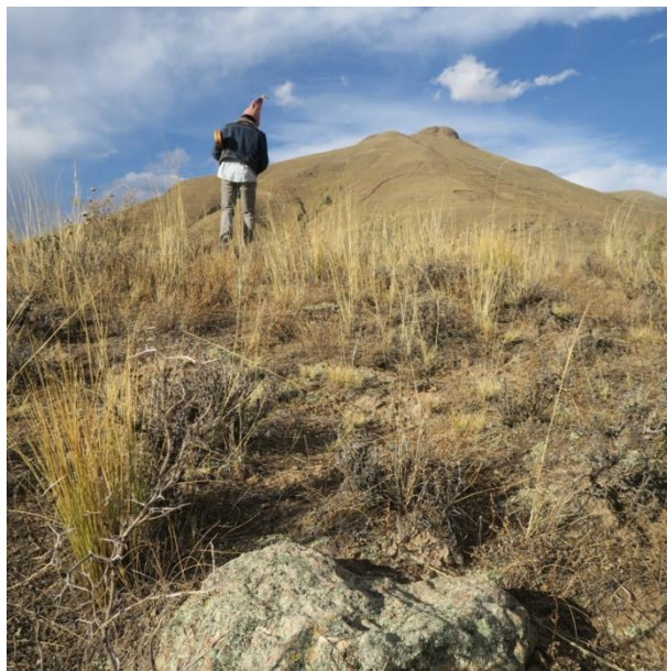
Fig. 4 : Pierre sous la protection et l'autorité de la montagne Huancarani, Nord Potosi (Bolivie), 2017

En définitive, dans les Andes, les pierres sont dotées d'une vie sociale riche : elles nouent des liens avec des êtres humains, avec des forces telluriques (le vent, la foudre), des animaux d'élevage (taureaux, lamas) et sauvages (mouffette, crapaud, souris), avec des montagnes et d'autres pierres. Appréhender les pierres dans un écosystème de relations qui ne soit pas exclusivement humain est donc indispensable.