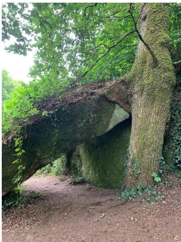
Fig.6 : Relations entre l'arbre et la pierre, Huelgoat (France), 2021

Ces réflexions ont donné lieu à un projet de recherche du Labex toulousain Structuration des Mondes Sociaux « Pierres Vivantes, une anthropologie du vivant à hauteur de pierres ». Ce travail comparatif montre que dans plusieurs sociétés, les pierres renvoient à la mobilité et l'incertain. Ces éléments peuvent sembler contre-intuitifs. Pourtant, plusieurs temporalités se manifestent dans les rapports que nouent les êtres humains aux pierres ; se rencontrent les temps lointains de la géologie, les temps plus proches des vies humaines ou encore les temps qui embrassent plusieurs générations. Du fait de cette collision, les pierres présentent des propriétés en apparence contradictoires : immobiles et fixes, les pierres sont aussi dotées de capacités d'apparaître ou de pousser ; dures et cassantes, elles font offense à l'être humain, mais elles sont malléables et souples dans la temporalité géologique.