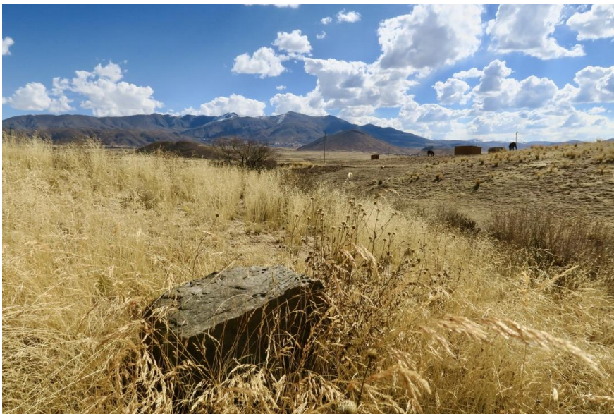
Fig. 1 : Nord Potosi (Bolivie), 2018

Pour la plupart des géologues, les pierres ne sont pas vivantes mais elles agissent 1 . À hauteur d'être humain, la mobilité des pierres est trop lente pour être perçue. Mais sur le temps long, les géomorphologues peuvent déceler la croissance d'un rocher ou d'une chaîne de montagne. Ils lisent les paysages comme l'histoire de mouvements. Les géologues ne sont pas les seuls à repérer ces mobilités. Dans différentes sociétés, des rochers ou des pierres de l'environnement sont réputées agir (un rocher tremble, une pierre avance, une autre pousse...). Ces pierres ne sont pas forcément taillées ou gravées ; elles ne font pas non plus toujours l'objet d'offrandes ou de prières. Comment cet agir des pierres est-il saisi et expliqué par les différents groupes qui sont en relation avec des pierres ?