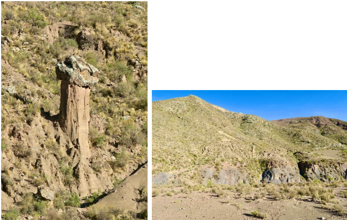
Fig. 2 : Cheminée de fée considérée comme la pétrification d'un grenier à grains, Nord-Potosi (Bolivie) 2017.

La perspective anthropologique classique a le mérite d'avoir insisté sur le rôle social des pierres. Celles-ci peuvent être employées pour améliorer l'agriculture ou pour soigner les gens ; elles peuvent être utilisées pour borner un espace ou maintenir des échanges interethniques. Elles peuvent enfin témoigner du passé d'une société ou révéler un geste technique. Laurence Charlier Zeineddine a voulu changer de perspective et insister sur le fait que les groupes n'ont pas obligatoirement un point de vue utilitariste et anthropocentré : les pierres ne sont pas toujours des ressources, des remèdes ou des réceptacles d'entités surnaturelles dont le pouvoir serait bénéfique. Ce point de vue plaide pour mener une recherche anthropologique « à hauteur de pierre », une recherche qui évite de subordonner inmanquablement les pierres aux activités humaines, techniques ou rituelles.