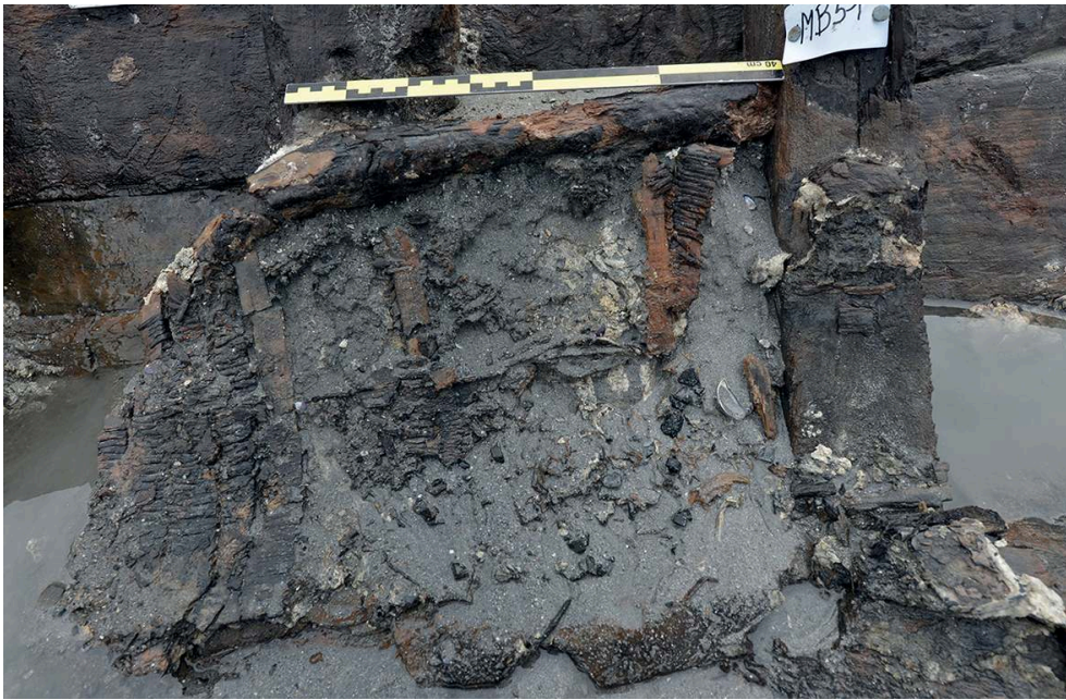
Fig. 3 – Dernières douelles de tonneau en place