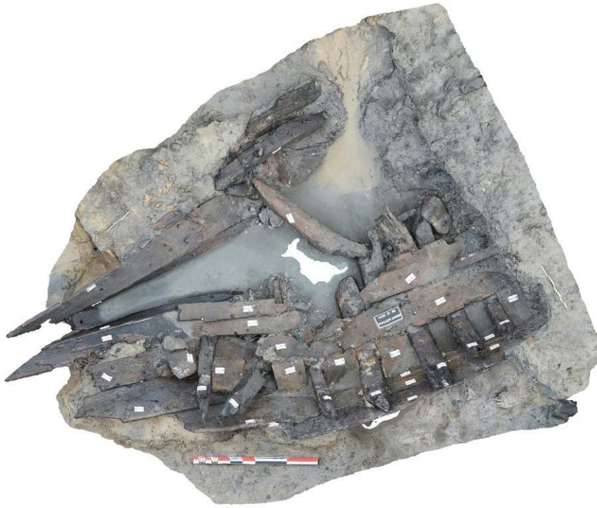
Fig. 2 – L'épave en 2014