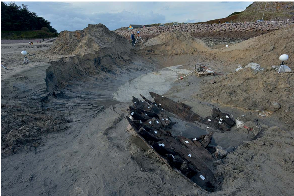
Fig. 4 – Les stations laser