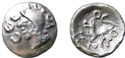
Figure 1 – Nuits-Saint-Georges (Côte-d'Or), Les Bolards (Musée archéologique de Dijon, collection Charrier ; clichés : J. Meissonnier, 3.VI.2022 ; 2,20 g, ca 12 mm ; \times 2 ).

Il est temps de donner une description du type à partir des exemplaires les mieux conservés puis de lister les exemplaires recensés.