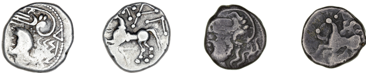
a. Laignes_0670 (1,96 g, 13 mm, 8 h)

Dans le cadre de travaux de thèse menés de 2017 à 2022, la question du classement des émissions de cette série a été explorée à nouveau, notamment en enrichissant le corpus de découvertes récentes ou de réattributions de types à la série ΚΑΛΕΤΕΔΟΥ 8 . Cette étude prend en compte la mise au jour, au cours de ces dix dernières années, des quatre seuls exemplaires connus frappés du type du coin du Mont Vully 9 (figure 4). La découverte de ce coin est ancienne et associée à plusieurs monnaies ΚΑΛΕΤΕΔΟΥ dont aucune ne correspondait au type du coin. Depuis, deux exemplaires portant cette image monétaire spécifique ont été recensés en Suisse 10 , tandis que deux autres étaient présents dans le dépôt monétaire de Laignes 11 (Côte-d'Or, figures 4a-b). La monnaie Laignes_0670 semble même avoir été frappée à l'aide du coin du Mont Vully, ou bien, plus probablement, cette monnaie aurait servi de modèle pour la création de ce coin. L'éloignement géographique des découvertes des monnaies de ce type ainsi que du coin monétaire montre à nouveau la large diffusion de la série ΚΑΛΕΤΕΔΟΥ et vraisemblablement des sites de frappe ou d'émission. Bien que le « O » de la légende initiale de la série ne soit pas visible, il semble que le traitement soigné du droit et le triangle inversé sous le cheval au revers doivent inciter à considérer cette émission comme appartenant au type A de Deyber et Scheers : au cheval au repos.