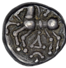
c. BnF 8188