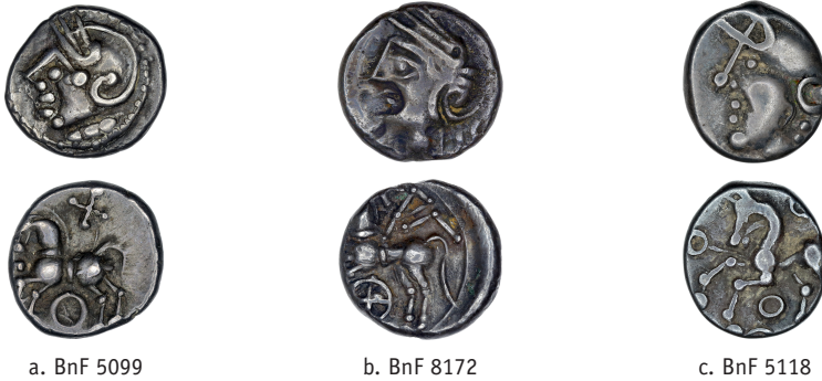
Figure 5 – Comparaison de l’iconographie d’un ex. identifié comme une monnaie à la Tête casquée (a) avec des exemplaires des séries ΚΑΛΕΤΕΔΟΥ (b) et à la Tête casquée (c) (× 1,5).

Il faut cependant constater que les monnaies du même type que BnF 5099 (figure 5a) présentent davantage de différences avec la série à la Tête casquée à laquelle elle avait été attribuée : le cheval est harnaché, contrairement à celui des exemplaires de type BnF 5118 (figure 5c), une rouelle est présente en dessous du cheval et non un simple anneau, la croix au-dessus du cheval ainsi que le collier de perles au droit des exemplaires de type BnF 5099 (figure 5a) sont des caractéristiques iconographiques partagées avec les monnaies de la série ΚΑΛΕΤΕΔΟΥ.