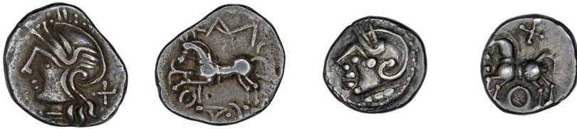
a. BnF 8270