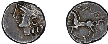
a. BnF 8287