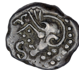
e. BnF 8227