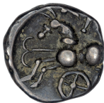
b. BnF 8160