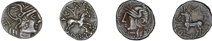
a. BnF 8297

des problèmes inhérents à la caractérisation des émissions ΚΑΛΕΤΕΔΟΥ, présente le même usage de la numérotation A1, 2, 3, B1, 2, etc. que celui employé par M. Nick 7 . Cependant ce dernier n'associe pas cette numérotation aux mêmes critères descriptifs.