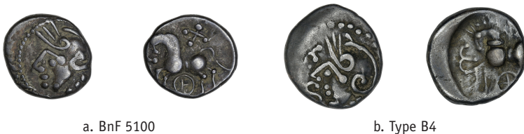
Figure 6 – Comparaison de l’iconographie d’un ex. identifié comme une monnaie à la Tête casquée (clichés : C. Bossavit) avec un exemplaire du type B4 de la série ΚΑΛΕΤΕΔΟΥ (LE DANTEC et al. 2021).

En continuant la comparaison, il faut noter la similarité de l’image monétaire des exemplaires de type BnF 5099 (figure 5a) ou BnF 5100 (figure 6a) avec l’émission B4 à la rouelle sous le cheval et aux lettres V et S devant le visage au droit (figure 6b). Certains exemplaires conservés au MAN et découverts dans le dépôt de Lavilleneuve-au-Roi montrent au revers un cheval surmonté d’une croix 13 , à l’image des exemplaires de type 5100 (figure 6a). Les monnaies de ce type doivent donc être réattribuées à la série ΚΑΛΕΤΕΔΟΥ, et il est même probable que ce type soit le même que le B4 (figure 6b).