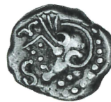
e. BnF 8227