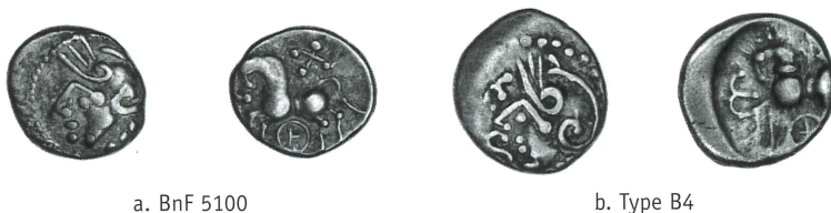
Figure 6 – Comparaison de l’iconographie d’un ex. identifié comme une monnaie à la Tête casquée avec un exemplaire du type B4 de la série ΚΑΛΕΤΕΔΟΥ (LE DANTEC et al. 2021).

En continuant la comparaison, il faut noter la similarité de l’image monétaire des exemplaires de type BnF 5099 (figure 5a) ou BnF 5100 (figure 6a) avec l’émission B4 à la rouelle sous le cheval et aux lettres V et S devant le visage au droit (figure 6b). Certains exemplaires conservés au MAN et découverts dans le dépôt de Lavilleneuve-au-Roi montrent au revers un cheval surmonté d’une croix 13 , à l’image des exemplaires de type 5100 (figure 6a). Les monnaies de ce type doivent donc être réattribuées à la série ΚΑΛΕΤΕΔΟΥ, et il est même probable que ce type soit le même que le B4 (figure 6b).