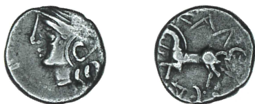
a. BnF 8287