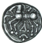
c. BnF 8188