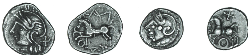
a. BnF 8270