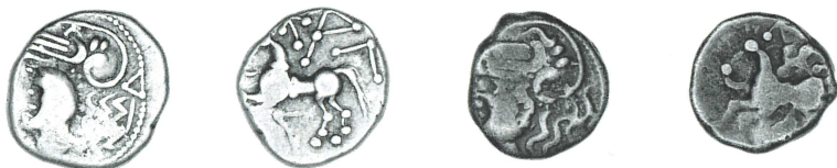
a. Laignes_0670 (1,96 g, 13 mm, 8 h)

Dans le cadre de travaux de thèse menés de 2017 à 2022, la question du classement des émissions de cette série a été explorée à nouveau, notamment en enrichissant le corpus de découvertes récentes ou de réattributions de types à la série ΚΑΛΕΤΕΔΟΥ 8 . Cette étude prend en compte la mise au jour, au cours de ces dix dernières années, des quatre seuls exemplaires connus frappés du type du coin du Mont Vully 9 (figure 4). La découverte de ce coin est ancienne et associée à plusieurs monnaies ΚΑΛΕΤΕΔΟΥ dont aucune ne correspondait au type du coin. Depuis, deux exemplaires portant cette image monétaire spécifique ont été recensés en Suisse 10 , tandis que deux autres étaient présents dans le dépôt monétaire de Laignes 11 (Côte-d'Or, figures 4a-b). La monnaie Laignes_0670 semble même avoir été frappée à l'aide du coin du Mont Vully, ou bien, plus probablement, cette monnaie aurait servi de modèle pour la création de ce coin. L'éloignement géographique des découvertes des monnaies de ce type ainsi que du coin monétaire montre à nouveau la large diffusion de la série ΚΑΛΕΤΕΔΟΥ et vraisemblablement des sites de frappe ou d'émission. Bien que le « O » de la légende initiale de la série ne soit pas visible, il semble que le traitement soigné du droit et le triangle inversé sous le cheval au revers doivent inciter à considérer cette émission comme appartenant au type A de Deyber et Scheers : au cheval au repos.