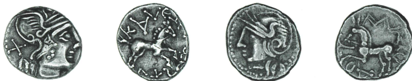
a. BnF 8297

des problèmes inhérents à la caractérisation des émissions ΚΑΛΕΤΕΔΟΥ, présente le même usage de la numérotation A1, 2, 3, B1, 2, etc. que celui employé par M. Nick 7 . Cependant ce dernier n'associe pas cette numérotation aux mêmes critères descriptifs.