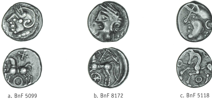
Figure 5 – Comparaison de l’iconographie d’un ex. identifié comme une monnaie à la Tête casquée (a) avec des exemplaires des séries ΚΑΛΕΤΕΔΟΥ (b) et à la Tête casquée (c) (× 1,5).

Il faut cependant constater que les monnaies du même type que BnF 5099 (figure 5a) présentent davantage de différences avec la série à la Tête casquée à laquelle elle avait été attribuée : le cheval est harnaché, contrairement à celui des exemplaires de type BnF 5118 (figure 5c), une rouelle est présente en dessous du cheval et non un simple anneau, la croix au-dessus du cheval ainsi que le collier de perles au droit des exemplaires de type BnF 5099 (figure 5a) sont des caractéristiques iconographiques partagées avec les monnaies de la série ΚΑΛΕΤΕΔΟΥ.