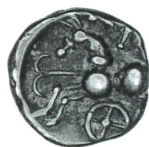
b. BnF 8160