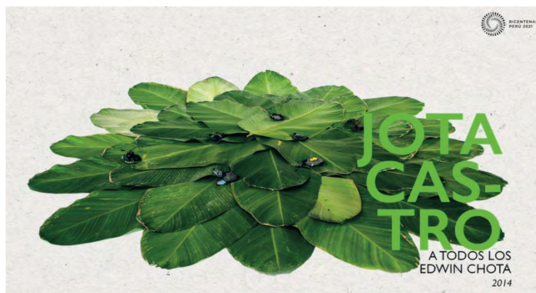
Illustration 5 : Captures d'écran de l'épisode 9 « El chullachaqui », œuvres d'Enrique Casanto et de Jota Castro.