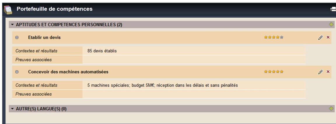
Figure 1 Viacesi: onglet "portfeuille de compétences" du Bilan