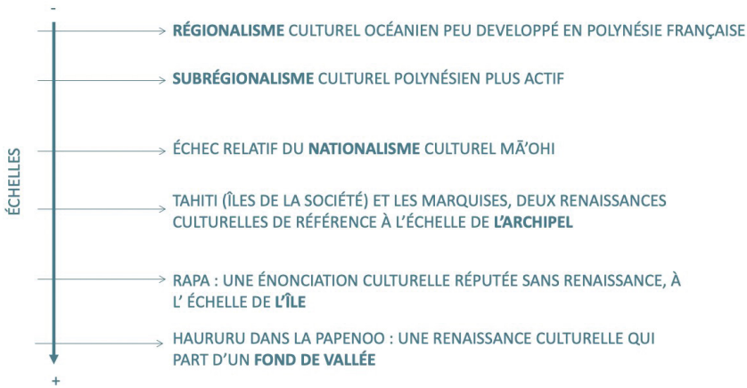
Figure 2 – Les échelles des renaissances culturelles en Polynésie française : approche géographique.