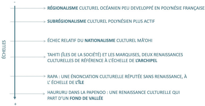
Figure 2 – Les échelles des renaissances culturelles en Polynésie française : approche géographique.