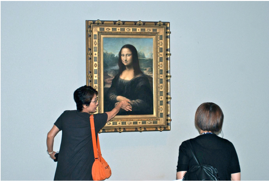
Figure 3 – Vue de l'intérieur du Musée international Ōtsuka, département de Tokushima, 2012

mettre un nez rouge sur le Cri de Munch, jouer librement avec les œuvres sans enfreindre aucune interdiction (voir la figure 3). Une expérience directe, vivante, profondément émancipatrice et démocratique est proposée à chacun, sans lourdeur ni affectation. Mais on pourrait aussi citer dans le même ordre d'idées le tout petit musée du Toucher ( Rokkōsan no ue bijutsukan – Sawaru myūjiamu ) à Kōbe, établissement privé ouvert en 2013, où les visiteurs sont, comme le nom l'indique, amenés à établir un contact physique et sensuel avec les œuvres de la collection, dont le clou n'est autre qu'un moulage en plâtre à taille réelle de la Vénus de Milo.