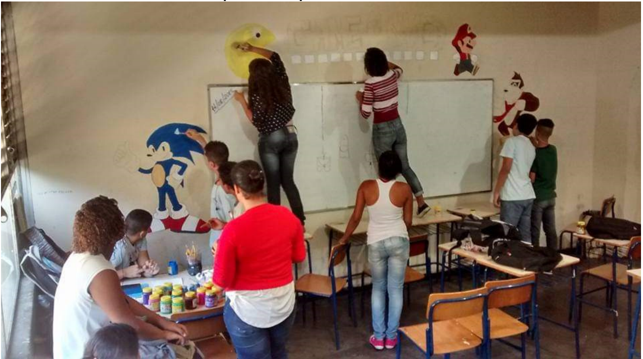
Figura 7 - Jovens de um CIEP no município de São Gonçalo se apropriam do espaço da sala de aula a partir de expressões artísticas