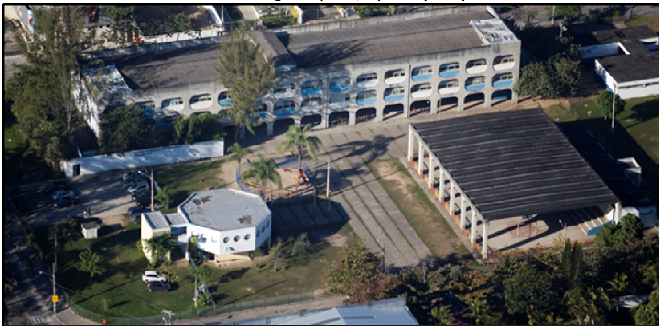
Figura 2 - Visão oblíqua de um CIEP. Em primeiro plano, biblioteca à esquerda e salão polivalente à direita. Em segundo plano, o prédio principal