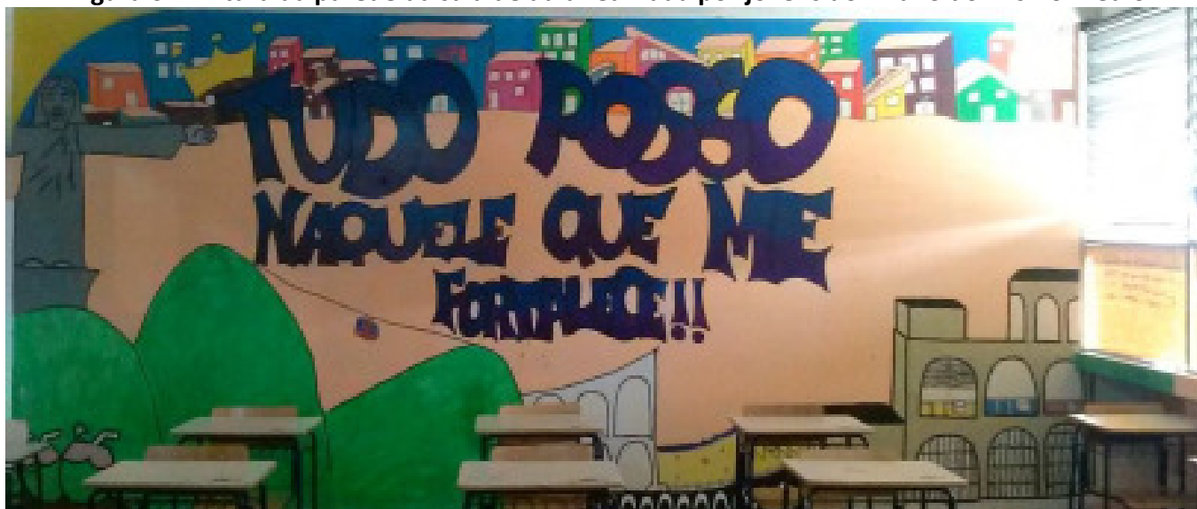
Figura 6 - Pintura da parede da sala de aula realizada por jovens do 1º ano do Ensino Médio

Em uma série de debates sobre o espaço urbano realizado durante a aula de Geografia, juntamente com bolsistas do Programa Institucional de Bolsa de Iniciação à Docência (PIBID-Geografia/UFF) em um CIEP do município de São Gonçalo (RJ), os jovens começaram a refletir sobre como poderiam alterar e produzir novas espacialidades na cidade. Foi então que decidiram trazer a cidade para dentro da escola, começando por uma intervenção na própria sala de aula. Incomodados com as paredes em cor bege iniciaram uma pintura na sala. A obra se estendeu por muitos dias, muitos dos quais os jovens permaneciam no espaço escolar mesmo fora do seu turno para lhe dar continuidade (Figura 6). O movimento inspirou que outras turmas realizassem o mesmo em suas salas de aula, intervindo na cidade a partir do espaço escolar, e se apropriando do espaço da sala de aula a partir da suas geo-grafias (Figura 7).