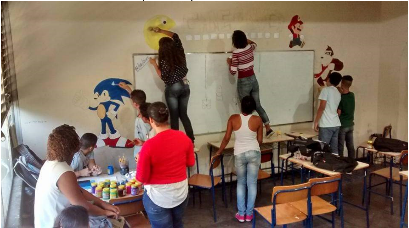
Figura 7 - Jovens de um CIEP no município de São Gonçalo se apropriam do espaço da sala de aula a partir de expressões artísticas