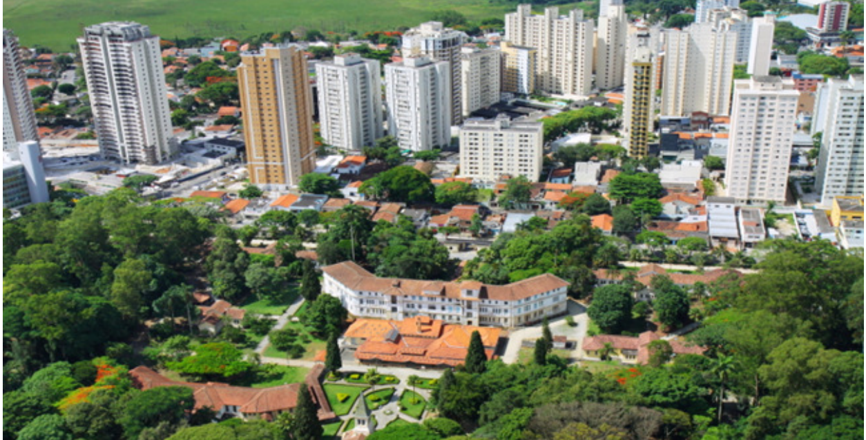
Figura 8 - Vista Panorâmica do centro de São José dos Campos ( 2013). Com uma população de 629 mil habitantes, uma superfície de 1.099,6 km 2 e uma altitude de 650 metros do nível do mar, São José dos Campos é considerada a capital do Alto Vale do Paraíba.