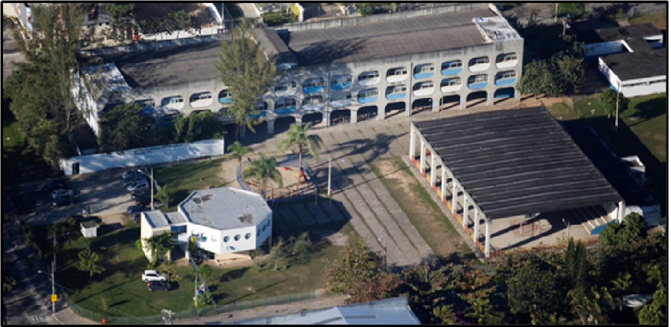
Figura 2 - Visão oblíqua de um CIEP. Em primeiro plano, biblioteca à esquerda e salão polivalente à direita. Em segundo plano, o prédio principal

Fonte: http://arqguia.com/obra/centros-integrados-de-educacao-publica-CIEPs , acesso em 05/05/2019