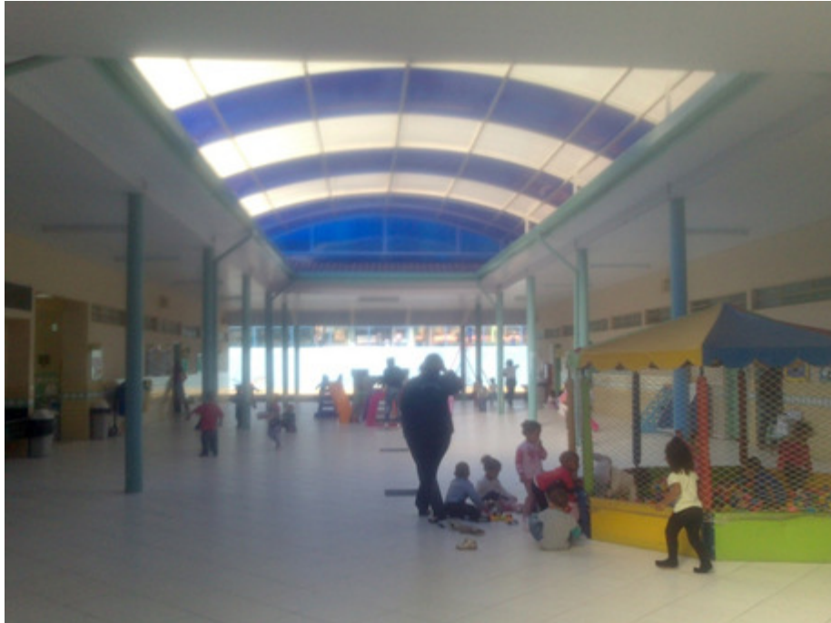
Figura 10 - Pátio da creche SJC (2013)

algumas mesas são empilhadas para as atividades da tarde. Na extrema esquerda há um parque com estruturas metálicas para crianças maiores de 4 a 6 anos” (Dados de campo, 2013)