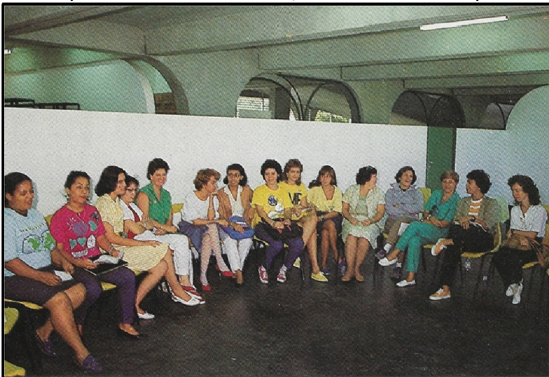
Figura 3 - Meias-paredes do auditório de um CIEP, mesmo formato adotado para salas de aula

As meias-paredes já nos apresentam um indício de que infância se desejava formar. Apesar de se reivindicar como um projeto inovador, a fala de Niemeyer nos aponta para uma infância em necessário silêncio, ou falando baixo de maneira ordeira a não incomodar aqueles que passassem ou, porventura, estivessem na sala ao lado. Atividades com músicas, dança, jogos ou brincadeiras coletivas nas salas de aula deveriam ser desestimuladas para não incomodar a ordem. É a forma do espaço buscando impor comportamentos. Como vimos, sem sucesso.