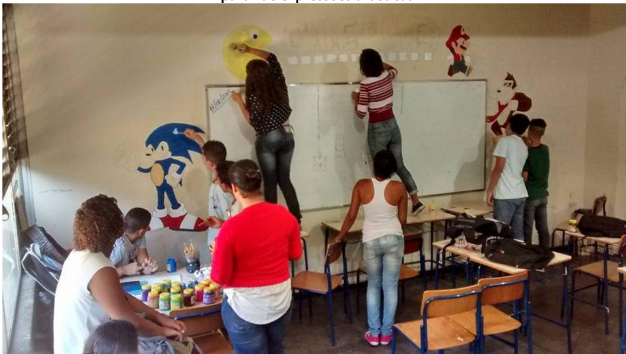
Figura 7 - Jovens de um CIEP no município de São Gonçalo se apropriam do espaço da sala de aula a partir de expressões artísticas