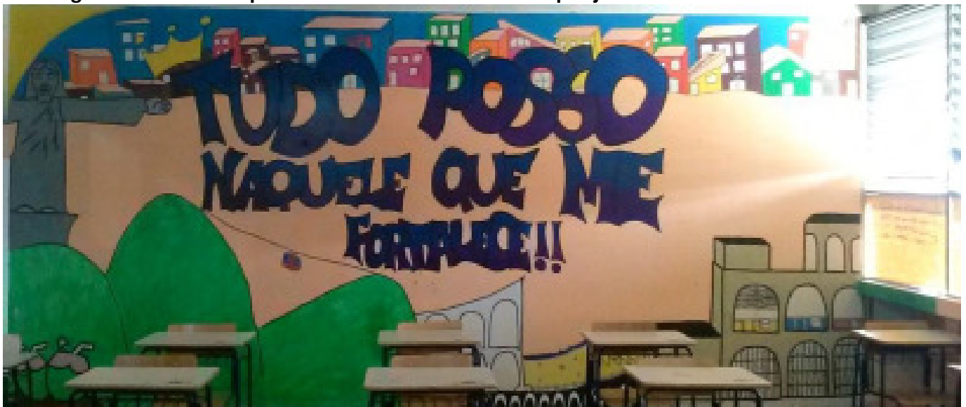
Figura 6 - Pintura da parede da sala de aula realizada por jovens do 1º ano do Ensino Médio

Em uma série de debates sobre o espaço urbano realizado durante a aula de Geografia, juntamente com bolsistas do Programa Institucional de Bolsa de Iniciação à Docência (PIBID-Geografia/UFF) em um CIEP do município de São Gonçalo (RJ), os jovens começaram a refletir sobre como poderiam alterar e produzir novas espacialidades na cidade. Foi então que decidiram trazer a cidade para dentro da escola, começando por uma intervenção na própria sala de aula. Incomodados com as paredes em cor bege iniciaram uma pintura na sala. A obra se estendeu por muitos dias, muitos dos quais os jovens permaneciam no espaço escolar mesmo fora do seu turno para lhe dar continuidade (Figura 6). O movimento inspirou que outras turmas realizassem o mesmo em suas salas de aula, intervindo na cidade a partir do espaço escolar, e se apropriando do espaço da sala de aula a partir da suas geo-grafias (Figura 7).