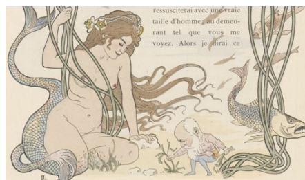
Illustration 4 : Léon Lebègue, Pervenche , Paris, Maison d'édition Crété A. Corbeil (imprimé pour Angelo Mariani), 1900, p. 10.

Indiens. Même si la coca a été depuis l'époque préhispanique une plante sacrée, il y a une volonté d'éloigner son utilisation des habitants ordinaires et de la transformer en une boisson de l'élite. Si dans l'image 3 la divinité refuse la coca à son peuple (le peuple andin péruvien), nous pouvons voir dans l'image de Léon Lebègue 33 (ill. 4) que la divinité est associée sans mal au travail d'exploration de Mariani.