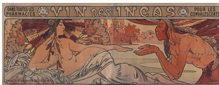
Illustration 3 : Alphonse Mucha, « Divinité Inca refusant la coca à son peuple », Paris, imprimerie Champenois, 1897.

Dans une même perspective allégorique, nous ferons allusion aux deux images qui montrent la relation entre Mariani et une divinité inca ou européenne. Pour vendre les produits à la feuille de coca il ne faut pas que de la science, le discours scientifique est mêlé facilement, dans le format publicitaire, à un discours ésotérique de l'ordre du surnaturel. L'exotisme de la feuille de coca contribue à mettre en avant ces deux éléments : pour l'aspect scientifique, c'est une plante sur laquelle les scientifiques allemands et français ont fait des progrès dans la caractérisation chimique des composants (notamment la cocaïne) et ses effets, et elle est déjà très utilisée pour soulager la douleur ; quant à la dimension exotique, il y a des témoignages, dans les écrits historiques de la conquête des Amériques et dans les récits des explorateurs européens en Amérique du Sud, du caractère sacré de la plante dans les cultures andines. Mariani réitère constamment l'argument de l'origine divine de la feuille de coca au Pérou préhispanique que nous pouvons voir dans les deux dernières illustrations (3 et 4) à travers les deux représentations féminines.