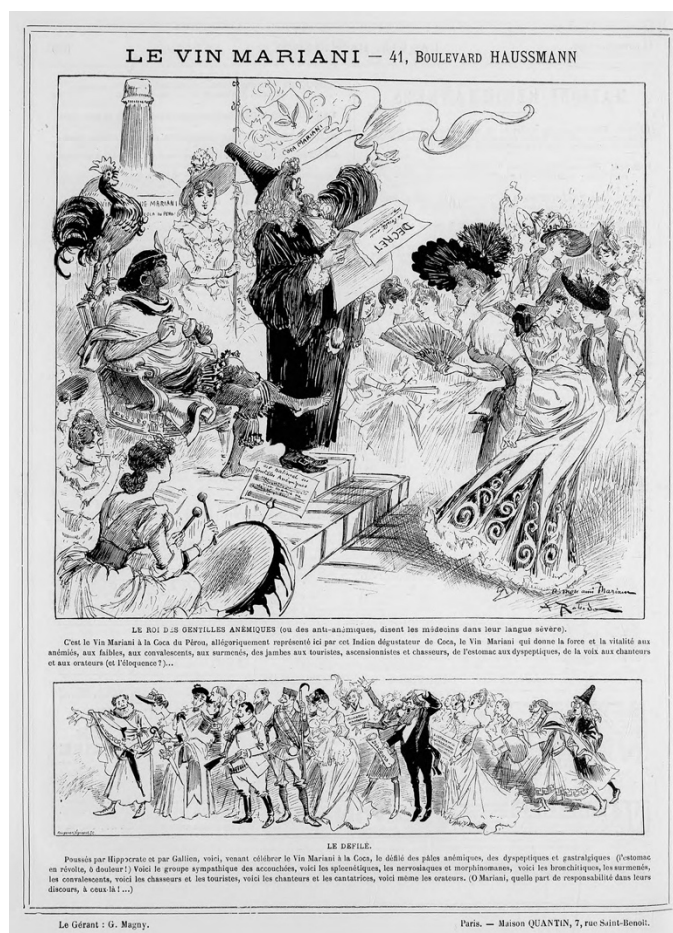
Illustration 2 : Albert Robida, « Le roi des gentilles anémiques », La Vie parisienne , 10 novembre 1888.

bouteille que nous voyons en arrière-plan est formé d'un savoir issu de la complicité de ce duo franco-péruvien qui occupe le même trône en tant que « Le roi des gentilles anémiques » (intitulé de la première image sur cette page) et qui regarde un défilé, une sorte de carnaval, où nous voyons des gens aux métiers divers (dans le domaine de l'art, de la politique, etc.) victimes de maladies modernes : les spleenétiques, les nervosiaques et les morphinomanes comme nous pouvons le lire dans la note explicative en dessous de la deuxième image.