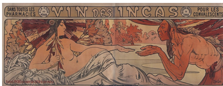
Illustration 3 : Alphonse Mucha, « Divinité Inca refusant la coca à son peuple », Paris, imprimerie Champenois, 1897.

Dans une même perspective allégorique, nous ferons allusion aux deux images qui montrent la relation entre Mariani et une divinité inca ou européenne. Pour vendre les produits à la feuille de coca il ne faut pas que de la science, le discours scientifique est mêlé facilement, dans le format publicitaire, à un discours ésotérique de l'ordre du surnaturel. L'exotisme de la feuille de coca contribue à mettre en avant ces deux éléments : pour l'aspect scientifique, c'est une plante sur laquelle les scientifiques allemands et français ont fait des progrès dans la caractérisation chimique des composants (notamment la cocaïne) et ses effets, et elle est déjà très utilisée pour soulager la douleur ; quant à la dimension exotique, il y a des témoignages, dans les écrits historiques de la conquête des Amériques et dans les récits des explorateurs européens en Amérique du Sud, du caractère sacré de la plante dans les cultures andines. Mariani réitère constamment l'argument de l'origine divine de la feuille de coca au Pérou préhispanique que nous pouvons voir dans les deux dernières illustrations (3 et 4) à travers les deux représentations féminines.