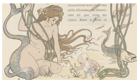
Illustration 4 : Léon Lebègue, Pervenche , Paris, Maison d'édition Crété A. Corbeil (imprimé pour Angelo Mariani), 1900, p. 10.

Indiens. Même si la coca a été depuis l'époque préhispanique une plante sacrée, il y a une volonté d'éloigner son utilisation des habitants ordinaires et de la transformer en une boisson de l'élite. Si dans l'image 3 la divinité refuse la coca à son peuple (le peuple andin péruvien), nous pouvons voir dans l'image de Léon Lebègue 33 (ill. 4) que la divinité est associée sans mal au travail d'exploration de Mariani.