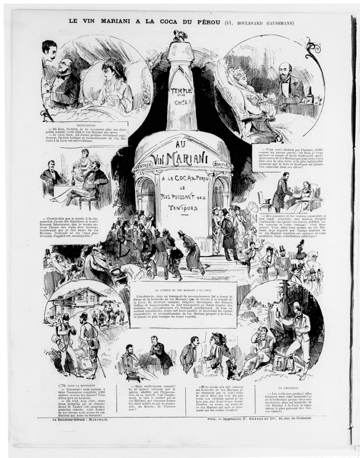
Illustration 1 : Albert Robida, « Le temple de la coca », La Vie parisienne , 31 mars 1877.

Nous allons montrer à titre d'exemples deux éléments importants en relation avec l'iconographie créée pour soutenir l'entreprise Mariani. À partir de 1877, Albert Robida, connu déjà en tant que dessinateur à La Vie parisienne , interviendra dans le projet Mariani avec des images sur les bienfaits du vin à la feuille de coca.