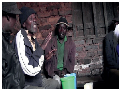
PHOTO 11. – Sa main part rapidement jusqu'à mi-hauteur lorsqu'il prononce, toujours en swahili, kabisa (« complètement »)

n'appelle pas de réponse), son commentaire sur la force de l'animal [17] et son anticipation sur la véracité de ses prémonitions [21] apporte son approbation et participe à renforcer les propos de Moze sur la dangerosité et les pouvoirs de l'oiseau. Samuéli [19], lorsqu'il évoque ici les griffes très longues de l'oiseau, reprend un détail du récit, déjà mis en avant par Ayubu [13], que Moze semble négliger. On peut se demander si Samuéli et Ayubu font référence à une variante de cette légende locale ou si tous les deux souhaitent apporter leur contribution en soulignant cet aspect important à leurs yeux et pas suffisamment mis en valeur par Moze.