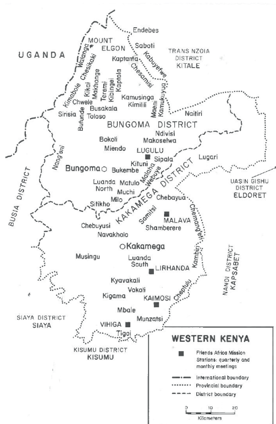
CARTE 6. – Les missions quakeresses dans la région ouest du Kenya (in Rasmussen, 1995)

cains arrivèrent au Kenya et ils établirent quatre autres missions, dont celle de Lugulu en pays bukusu.