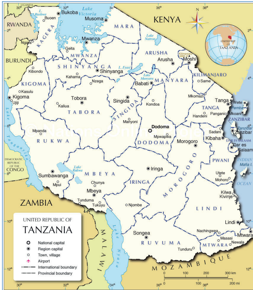
CARTE 1. – Carte administrative de la Tanzanie, issue de Nations Online Project ( www.nations-online.org )