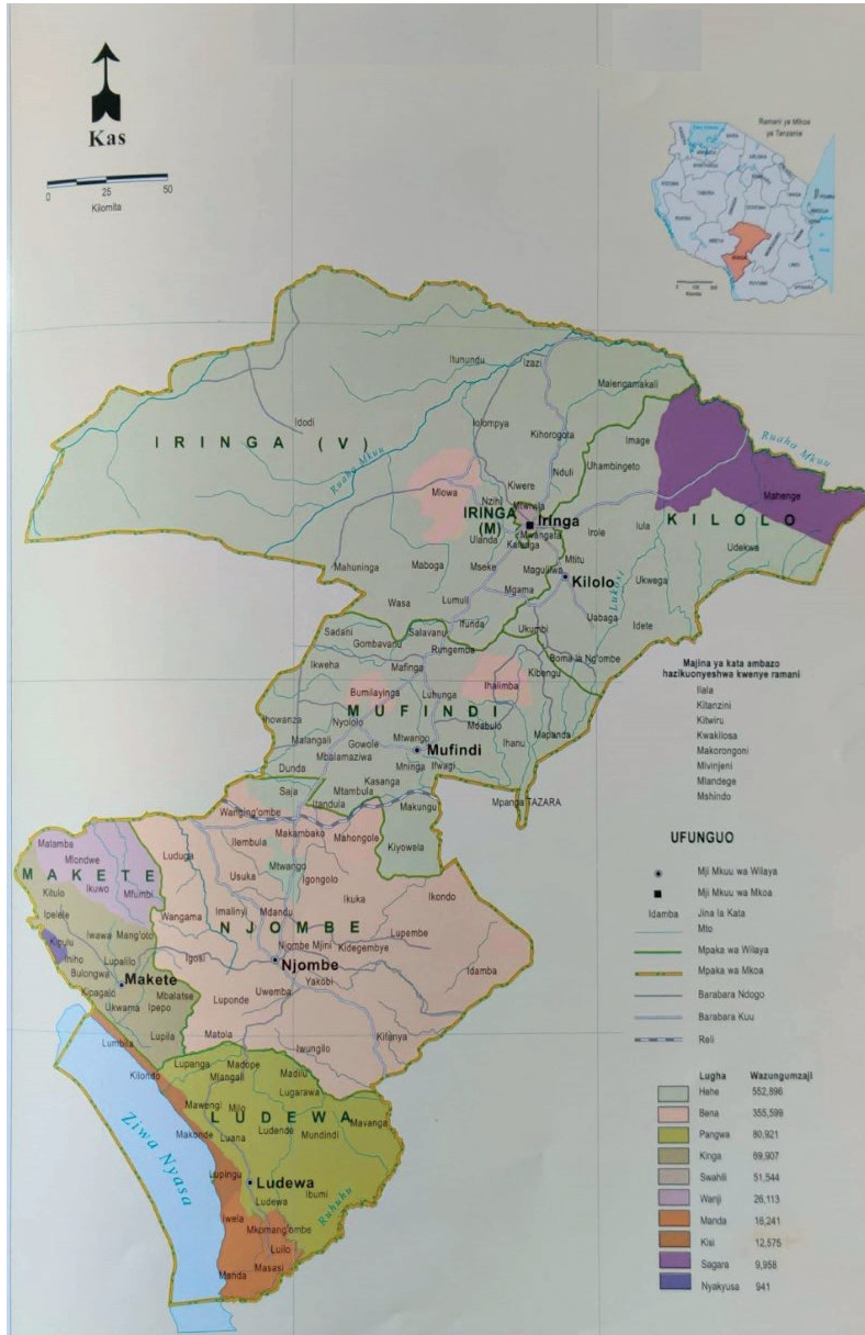
CARTE 3. – Carte de la répartition des langues les plus parlées dans la région d'Iringa (Mkoa wa iringa. Lugha ya kwanza kwa ukubwa, Languages of Tanzania Project , 2009 : 19)