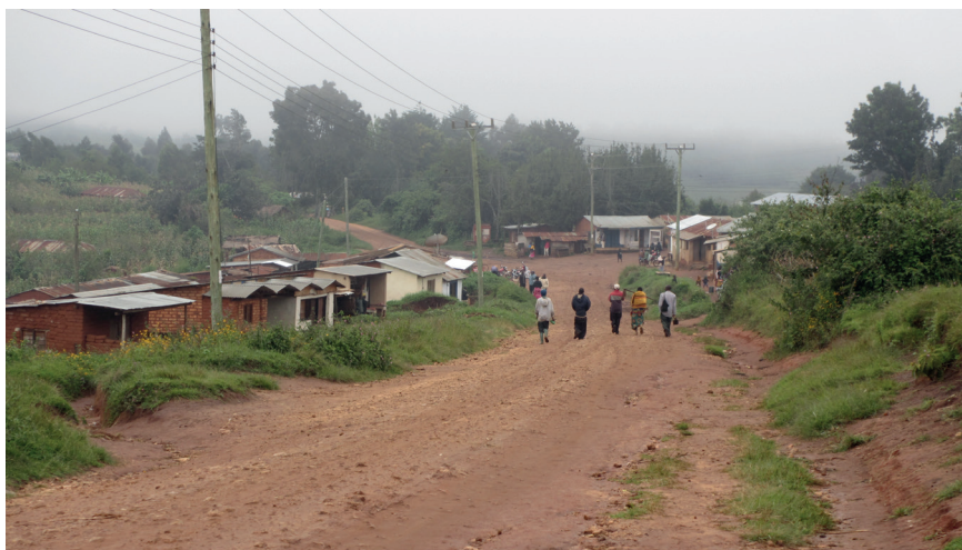
Arrivée d'un groupe de villageois au centre du village de Lulanzi dans les brumes matinales. Ils descendent vers le carrefour principal du village, où se trouvent la plupart des boutiques ainsi que l'arrêt du bus menant en ville. On remarque également les lignes électriques sur la gauche et au fond de l'image qui raccordent différentes boutiques.

PHOTO 4. – Descente sur le centre du village, Lulanzi (mai 2013)