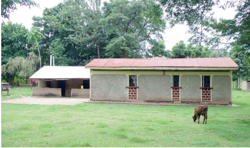
Vue de côté de la maison des Mukoyandali au village de Mayanja, près de Bungoma. Derrière le veau, du premier plan on distingue les fenêtres des chambres et sur la gauche la petite terrasse de la cuisine où sont préparés les aliments et où les femmes de la maisons se retrouvent pour discuter

PHOTO 18. – La maison principale Mukoyandali, Mayanja (juillet 2018)