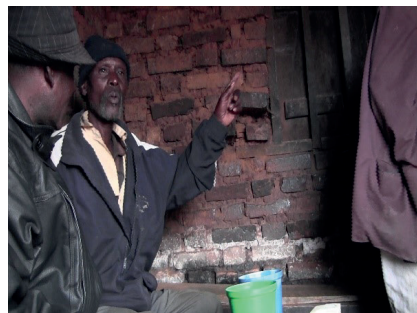
PHOTO 14. – Il déplie rapidement son bras tout en imitant le cri de l'oiseau : huuuuuuu

l'inversion entre la proposition adverbiale et le verbe permet de mettre en valeur ce dernier et de renforcer le contraste de rythme et de langue qui sert la mise en scène des actions fulgurantes de l'oiseau.