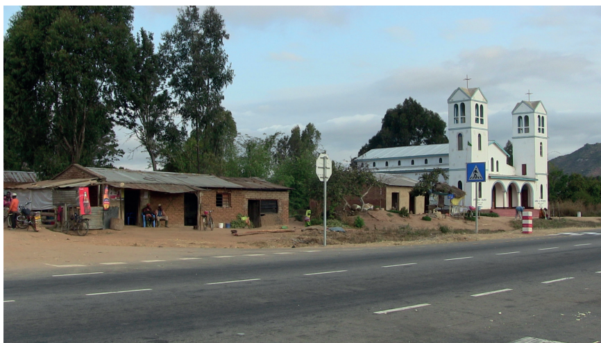
Station de bus de Wenda. Au premier plan la route goudronnée reliant Iringa à Mbeya et Njombe. Sur la gauche un groupe de jeunes avec leur moto. À côté, un bar où l'on sert des bières industrielles et des sodas. Au dernier plan à droite, l'église orthodoxe de Wenda

PHOTO 15. – La route et l'église de Wenda (juillet 2013)