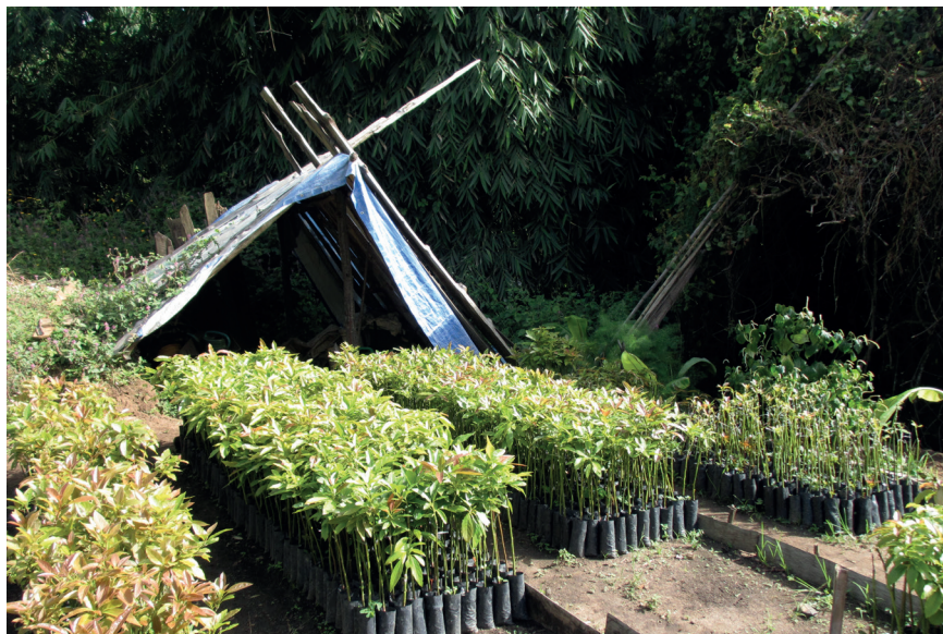
Pépinière de Chesco. Au premier plan, différentes rangées d'avocatiers réparties en fonction du degré de maturité et du greffage. Au second plan la tente où Chesco range ses outils et arrosoirs