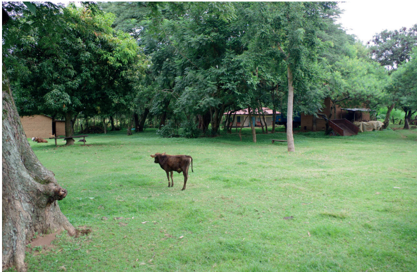
Vue de côté de la maison des Mukoyandali au village de Mayanja, près de Bungoma. Derrière le veau, du premier plan, on distingue les fenêtres des chambres et sur la gauche la petite terrasse de la cuisine où sont préparés les aliments et où les femmes de la maisons se retrouvent pour discuter

PHOTO 18. – La maison principale Mukoyandali, Mayanja (juillet 2018)