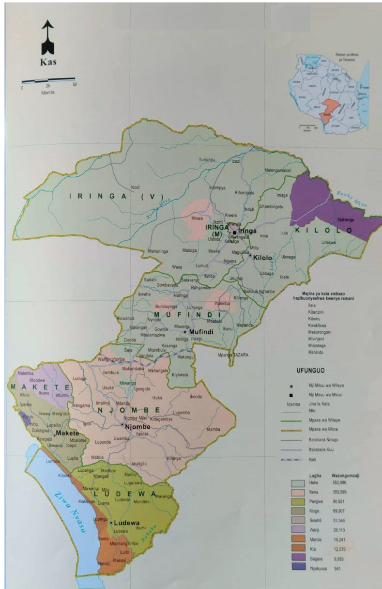
CARTE 3. – Carte de la répartition des langues les plus parlées dans la région d'Iringa (Mkoa wa iringa. Lugha ya kwanza kwa ukubwa, Languages of Tanzania Project , 2009 : 19)