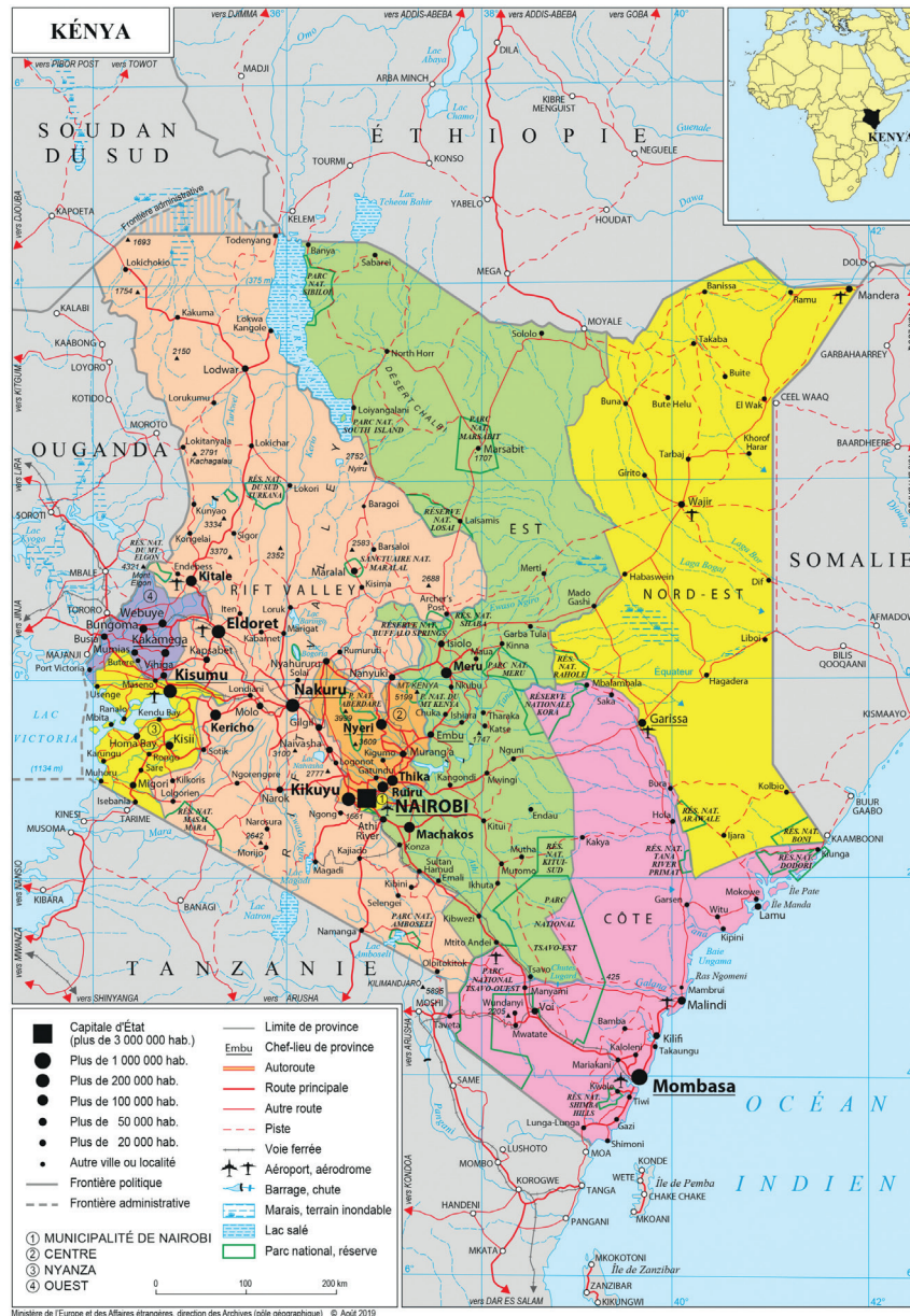
CARTE 5. – Carte politique du Kenya de 2019 ( https://www.worldmaps.info/Kenya/ )