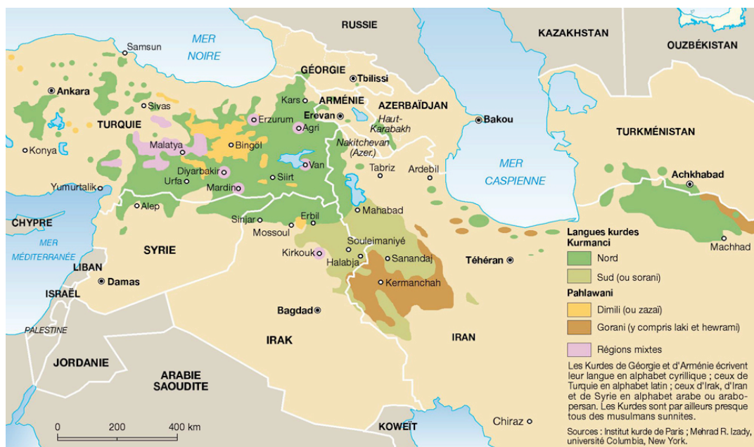
Figure 2-1: La carte linguistique du Grand Kurdistan

La carte ci-dessous met en regard la répartition des différents dialectes kurdes dans les régions kurdes au Moyen-Orient.