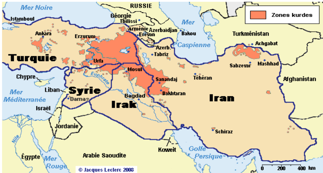
Figure 1.1: Les zones kurdes sur la carte géographique

La carte ci-dessous met en regard le Grand Kurdistan avec quelques îlots en Arménie, Géorgie, Azerbaïdjan, Turkménistan, Kirghizie et Kazakhstan où les Kurdes sont répartis. 4