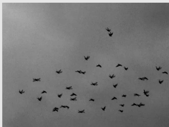
Capture écran de Mémoires flottantes (Vol d'oiseaux noirs (y'a pas de leader)) de Gwenola Wagon et Alexis Chazard, 2005

contenu du cd-rom sur le disque dur de l'ordinateur, et lancé Mémoires Flottantes par un double-clic. Un premier écran, furtif, nous indique que le programme est réalisé sous MaxMsp 5 . On est alors de suite emporté dans l'image : c'est un film, et non une interface : ni menus ni icônes ne trahissent la présence de signes d'interactivité en direction du lecteur. On lâche donc la souris, qui ne nous servira pas, on adopte le recul du spectateur, se demandant ce qui motive cette posture inhabituelle dans un environnement qui convoque usuellement son lecteur à une activité. Mémoires flottantes est pourtant bien un dispositif interactif, au sens où il s'agit d'une propriété interne 6 du système de monstration. Mais cette interactivité ne nécessite pas la participation active du spectateur, qui reste dans la posture du spectateur du cinématographe.