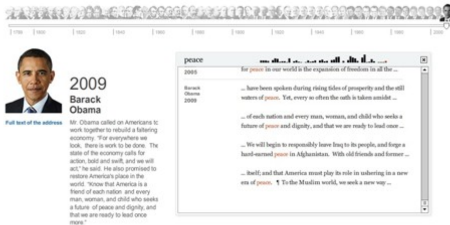
figure 3 – ici avec la sélection du mot-clé « peace » en situation dans l'interface

critique, l'hypertexte lui, peut encore souvent être qualifié d'hypotexte dans le sens où il ne crée pas – tel quel – de surcroît d'intelligibilité mais déstabilise le lecteur par l'absence d'horizon de lecture. C'est qu'il reste à appareiller l'hypertexte « d'instruments lectoriaux dont l'utilisation effective correspond à l'actualisation d'une lecture. », permettant ainsi l'avènement du sens.