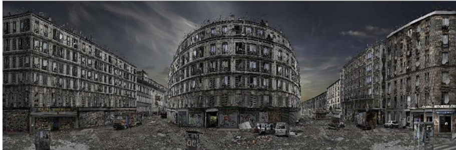
figure 1 © Jean François Rauzier, Hyperphoto, 2008

Sur le panoramique intitulé la Cité Idéale (figure 1), on souligne d'emblée la citation vers la scène fondatrice de la perspective selon le célèbre tableau (vers 1470) attribué à Piero della Francesca ou Francesco di Giorgio Martini.