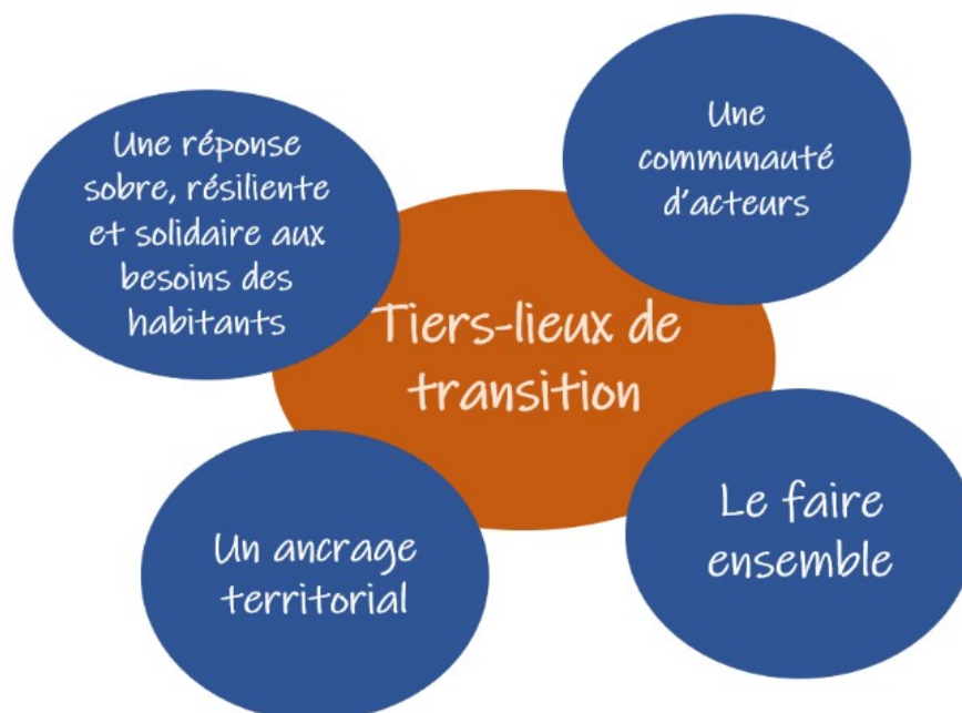
Figure 1 – Le mapping des Tiers-lieux de transition selon le programme TES.

A la lecture de cette figure, il nous semble que le pilier « Le Faire Ensemble » est un déterminant endogène du modèle de coopération du tiers-lieu lui-même, en son sein et parce qu'il