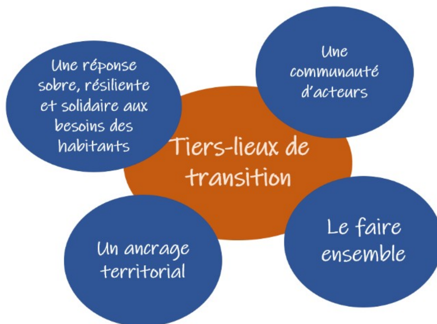
Figure 1 – Le mapping des Tiers-lieux de transition selon le programme TES.

A la lecture de cette figure, il nous semble que le pilier « Le Faire Ensemble » est un déterminant endogène du modèle de coopération du tiers-lieu lui-même, en son sein et parce qu'il