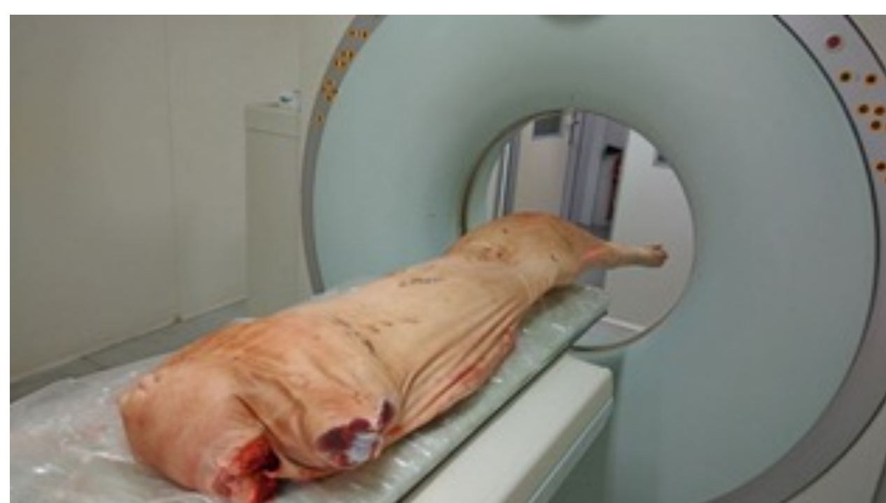
Scan d'une demi-carcasse