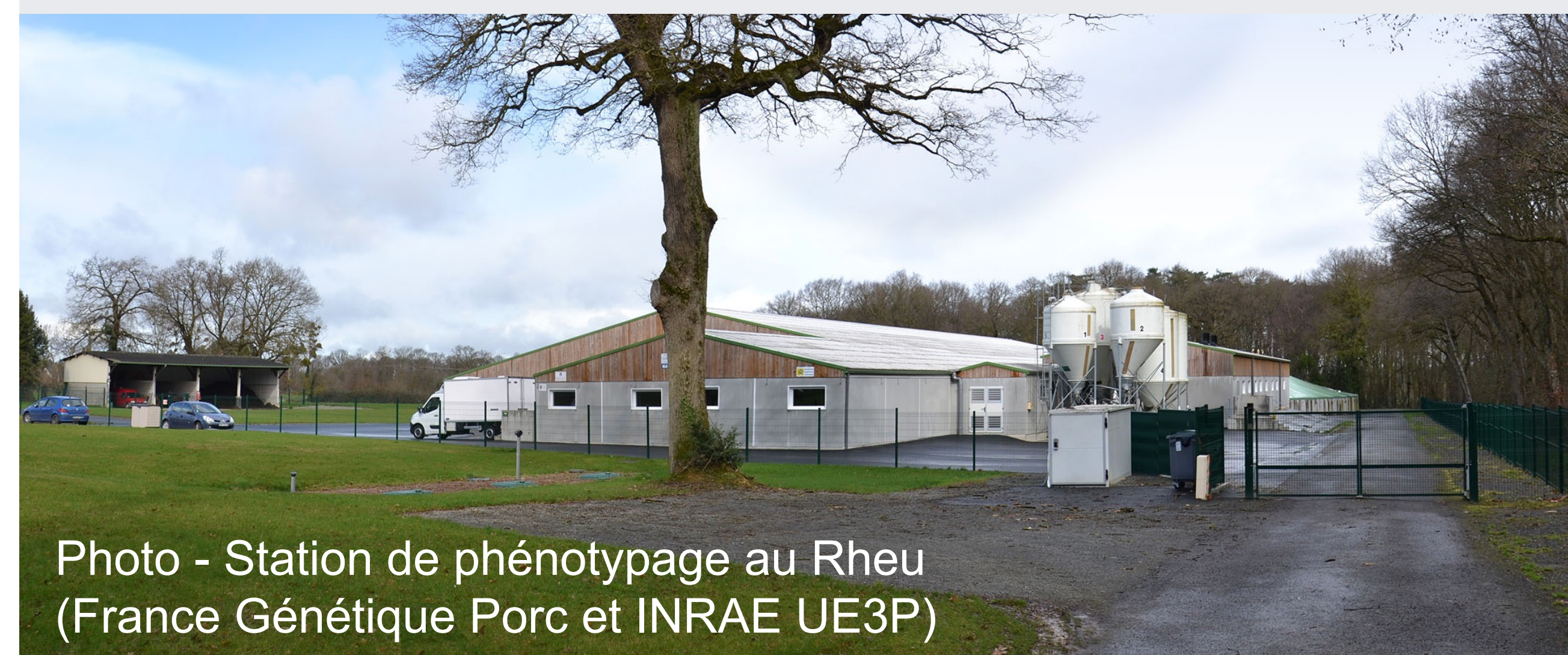
Photo - Station de phénotypage au Rheu (France Génétique Porc et INRAE UE3P)

Les critères GMQm et ICm ont des coefficients de variation nettement supérieurs à ceux des critères actuels (GMQ et IC), ce qui renforce leur intérêt pour la sélection des reproducteurs. Les corrélations entre les critères testés et les critères actuels diffèrent entre les femelles des lignées mâles et les mâles des lignées femelles. Etant presque toutes inférieures à 0,8, cela justifie de poursuivre les recherches sur l'évaluation de l'intérêt de l'introduction de ces critères en sélection, notamment en lignée mâle.