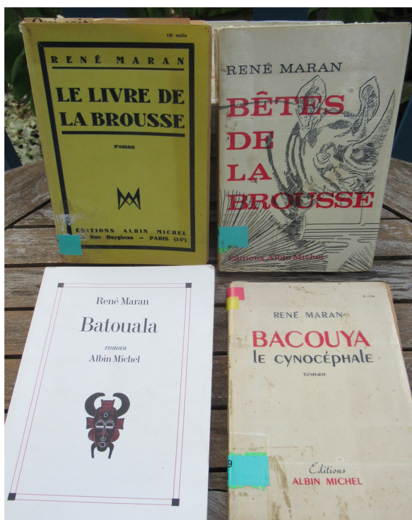
Illustr. Quelques ouvrages du Cycle de la brousse (BU-Schoelcher)