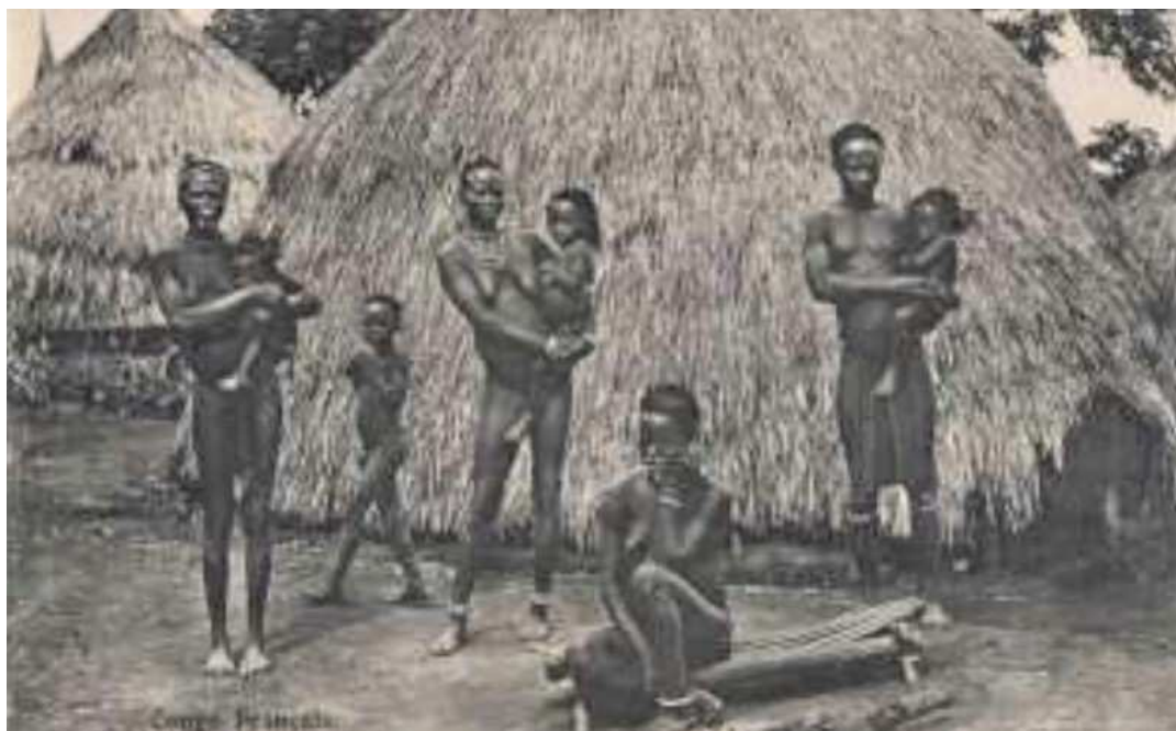
Illustr. Famille dans la brousse africaine vers 1900

« Après quatorze ans d'agonie, une période de ma vie est morte... / J'ai renoncé à l'Afrique pour toujours. La vie civilisée m'a repris d'un coup... / Il est néanmoins des jours où je me laisse aller au souvenir... / La brousse m'a imprégné de ses radiations les plus secrètes et surtout de l'horreur sacrée dont elle envoûte ce qui l'entoure./ Elle m'a saturé de souvenirs. Je me rappelle des riens, qui sont pour moi des bijoux... ».