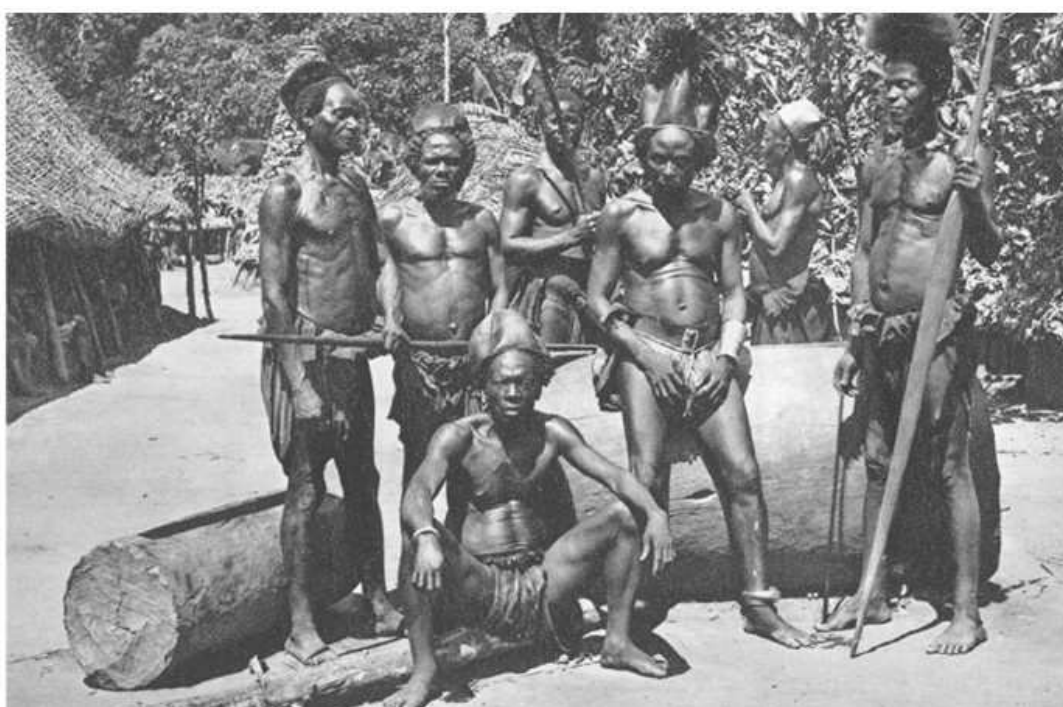
Illustr. Guerriers de l'Oubangui

Une autre raison qui explique l'absence de prise de conscience de la particularité du Cycle de la brousse, est tout simplement la rareté de ces livres, dont aucun n'a jamais eu le succès de Batouala – sacré par le Goncourt et magnifié par le scandale – et plusieurs n'ont jamais été réédités après leur sortie originelle. Ainsi Djouma – publié en 1927 juste après Batouala et Le Petit Roi de Chimérie – n'est répertorié que dans deux des bibliothèques de toutes les universités de France 4 . Beaucoup d'universités en Afrique – de création récente, ne possèdent guère que Batouala , seule œuvre qui soit restée au catalogue d'Albin Michel sans interruption : Goncourt à succès oblige.