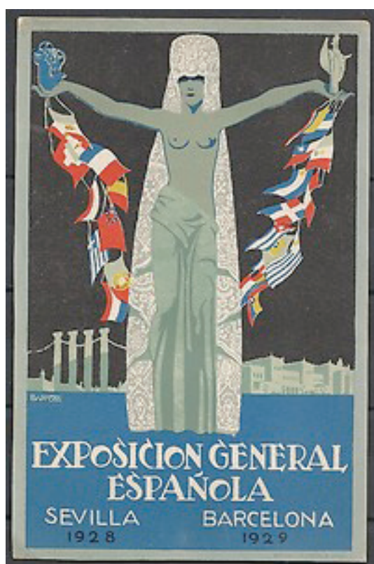
Figure 3. Affiche annonçant l'Exposition Générale espagnole de Séville et de Barcelone 23

La déclinaison sévillane fait partie d'une exposition générale espagnole qui comprend deux volets : l'exposition ibéro-américaine de Séville et l'exposition internationale de Barcelone (fig. 3). Dans l'organisation de l'événement, les deux capitales andalouse et catalane entrent donc en concurrence, chacune se voulant la vitrine du dynamisme de leur région et l'expression d'un idéal pour l'Espagne. L'exposition sévillane se concentre sur l'art, la culture et l'héritage historique 22 ; celle de Barcelone, consacrée au progrès matériel, porte sur le commerce, l'industrie et les techniques dans une perspective plus utilitariste.