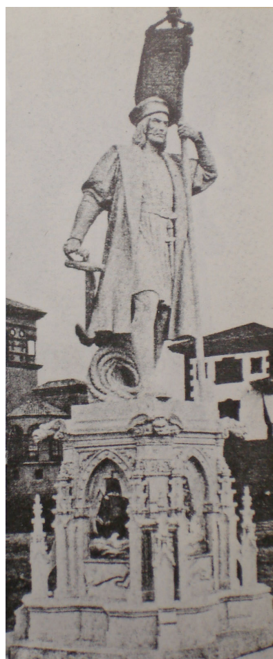
Figure 7. Statue de Christophe Colomb située sur la place des Conquistadors 39

Ce premier ensemble consacré aux figures du passé est complété par un monument allégorique censé représenter la perpétuation de cette tradition : au milieu de la place se dresse la fontaine de la Raza , ou fontaine des Conquistadors. Réalisée en 1928 par José Granados de la Vega, elle se compose d'une statue de l'Hispanie de quatre mètres de hauteur, encadrée par deux autres allégories symbolisant le fleuve Guadalquivir et un fleuve américain avec leurs attributs respectifs 40 . Le socle central représente la proue d'un bateau, en référence à l'épopée américaine, et donne sur un bassin. Enfin, deux figures de proue situées sur les socles latéraux constituent les jets d'eau. La composition du monument reproduit en quelque sorte le schéma d'une famille « raciale » réunie autour de la figure féminine de l'Hispanie, représentation maternelle de l'Espagne. Comme sur la fontaine de la langue castillane édifiée sur la partie