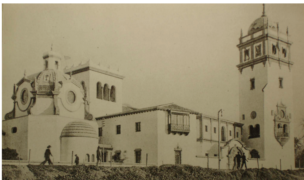
Figure 8. Façade du pavillon de l'Argentine donnant sur le Guadalquivir 44

selon des modes fort différents la place de cet héritage dans leur propre culture nationale. Ainsi, le pavillon argentin réalisé par le directeur général des Beaux-Arts Martín Segundo Noel se veut le reflet d'une Argentine revendiquant avec orgueil son ascendance hispanique (fig. 8). Reproduction d'une riche demeure seigneuriale de style baroque, il constitue une « sorte d'hommage cordial » destiné à prouver à l'Espagne l'affection de la république, si l'on en juge par les déclarations de l'envoyé spécial du gouvernement argentin, l'écrivain hispanophile Enrique Larreta 43 : « ¿Cómo no había de figurar [la República Argentina] en esta grandiosa romería de las naciones de América; y tan luego en Sevilla, (...) en la más Americana, en la más Indiana de vuestras Ciudades? ». Celui-ci n'ajoute-t-il pas, à l'attention du roi Alphonse XIII et du général Primo de Rivera qui assistent à la cérémonie, que l'Argentine a été la première des républiques latines à officialiser sa participation à l'exposition (ce qu'elle fait par décret du 25 juin 1925), s'associant de la sorte au « pèlerinage grandiose des nations américaines ».