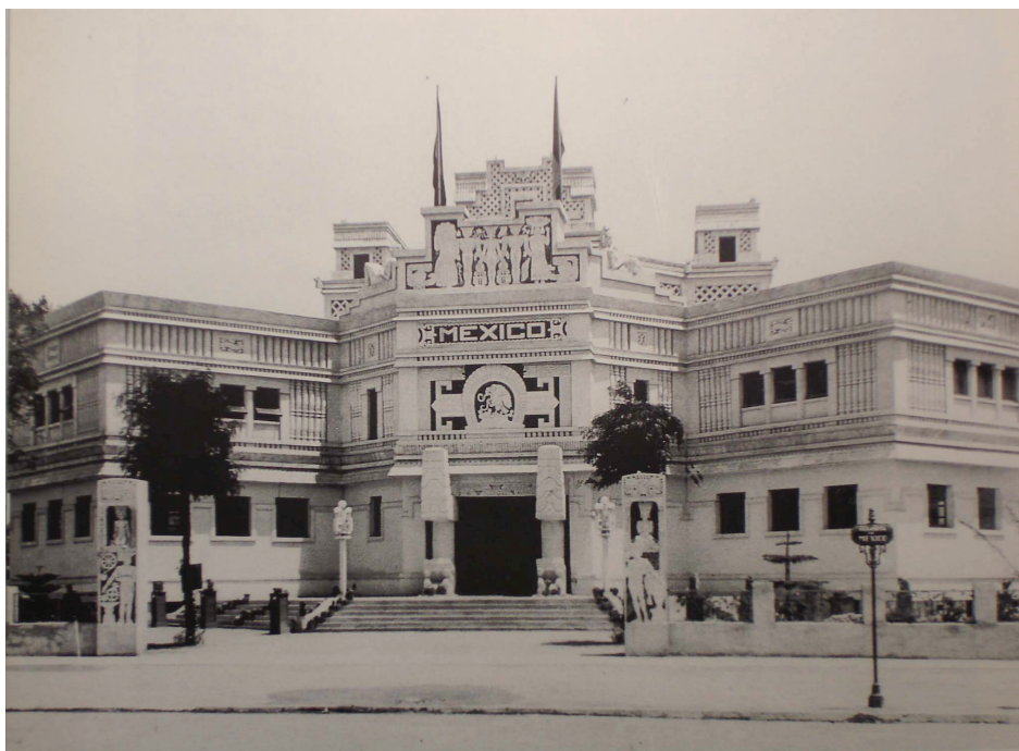
Figure 9. Façade principale du pavillon du Mexique 46

une frise au dessus de l'entrée principale, accompagné de la légende constituant le slogan de l'université nationale de Mexico : « Por Mi Raza Hablará El Espíritu ».