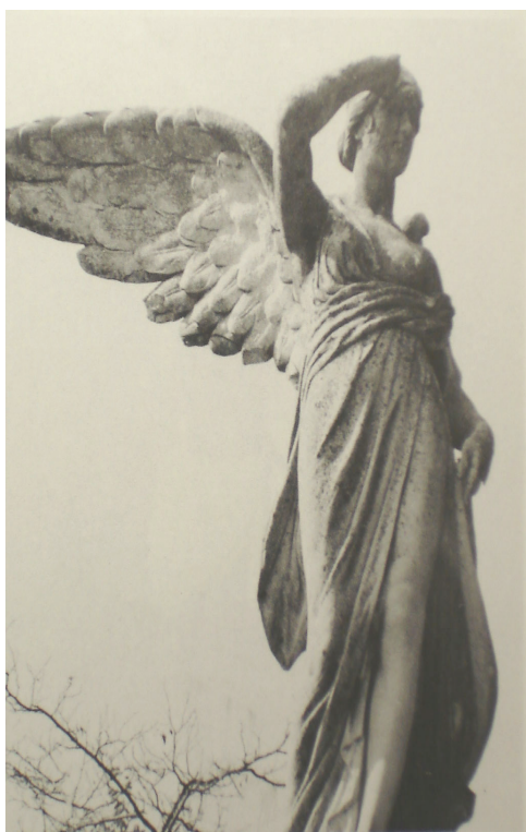
Figure 6. Victoire ailée située sur la place de l'Amérique 38

visage révèle un caractère énergique, ferme et résolu, éloigné des représentations traditionnelles issues des courants romantiques (fig. 7). La bannière royale de la Castille que le marin génois brandit complète ce tableau composé à la gloire de l'Espagne découvreuse.