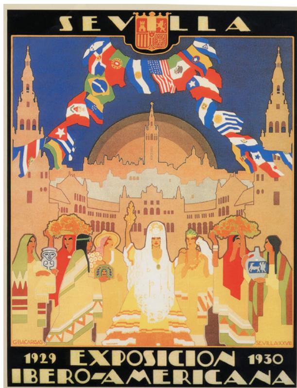
Figure 4. Affiche de l'Exposition Ibéro-américaine (signée Gustavo Bacarisas) 31

l'exposition confirme ce schéma familial. Au-dessus de l'entrée principale sont gravés, tels une inscription propitiatoire, les deux premiers vers du poème « Salutación del optimista » du poète nicaraguayen Rubén Darío : « Ínclitas razas ubérrimas, sangre de Hispania fecunda, / espíritus fraternos, luminosas almas, ¡salve! ». L'enceinte est ainsi placée sous l'égide d'un emblème continental, de la langue espagnole et de la célébration de la fraternité raciale.