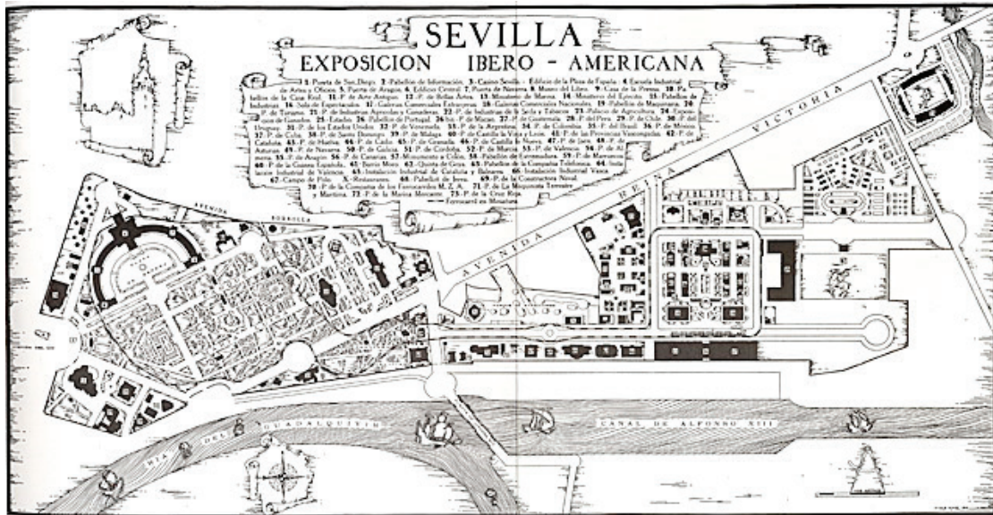
Figure 5. Le plan de l'Exposition Ibéro-américaine de 1929 32

La dominante historiciste de l'ensemble émane aussi des choix architecturaux. L'exposition est projetée dans le but d'édifier une « Nouvelle Séville » et contribue à en moderniser les infrastructures, preuve en est le nouveau quartier d'Heliopolis sur les rives du Guadalquivir, destiné à héberger les visiteurs. Pourtant, la centaine de pavillons officiels et privés et les monuments construits pour l'exposition obéissent par leur style à un net historicisme architectural, choix qui traduit une forme de nostalgie pour les splendeurs du passé impérial. Aníbal González, architecte en chef de l'exposition depuis 1911, est un théoricien sévillan du régionalisme influencé par le traditionalisme de l'historien de l'art Vicente Lampérez. Le projet qu'il conçoit en 1912 pour l'exposition consiste en un prolongement du parc María Luisa qui doit réunir les pavillons provinciaux et ceux des républiques invitées, à travers des petites places ou rotondes décorées par des monuments commémoratifs. L'agencement et la configuration de ces différents espaces illustrent la lecture complexe du passé impérial et de la réalité post-coloniale faite de part et d'autre de l'Atlantique.