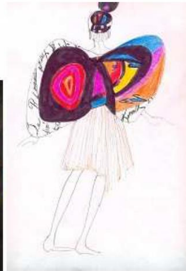
Liberté,-pavillon tendu sur les mers d'azur- Tableau, Céramique, Costume

La scène réunit les états successifs du poème-calligramme pour de nouvelles expériences :