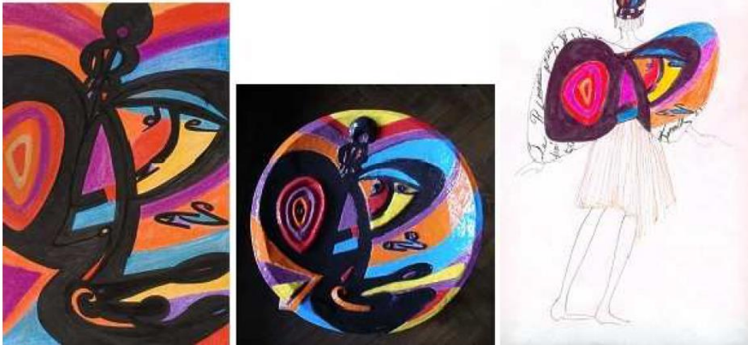
Liberté,-pavillon tendu sur les mers d'azur- Tableau, Céramique, Costume

émaux, et aux effets des multiples cuissons. J'ai donc dû chercher de nouvelles couleurs en émaux (elles se modifient à chaque cuisson), expérimenté la calligraphie en creux ou en volume sur la glaise molle, développé spatialement mes tableaux-poèmes. Les robes-poèmes poussent plus loin cette expérience, puisque les corps des danseurs animent les tableaux-poèmes inclus dans les robes.