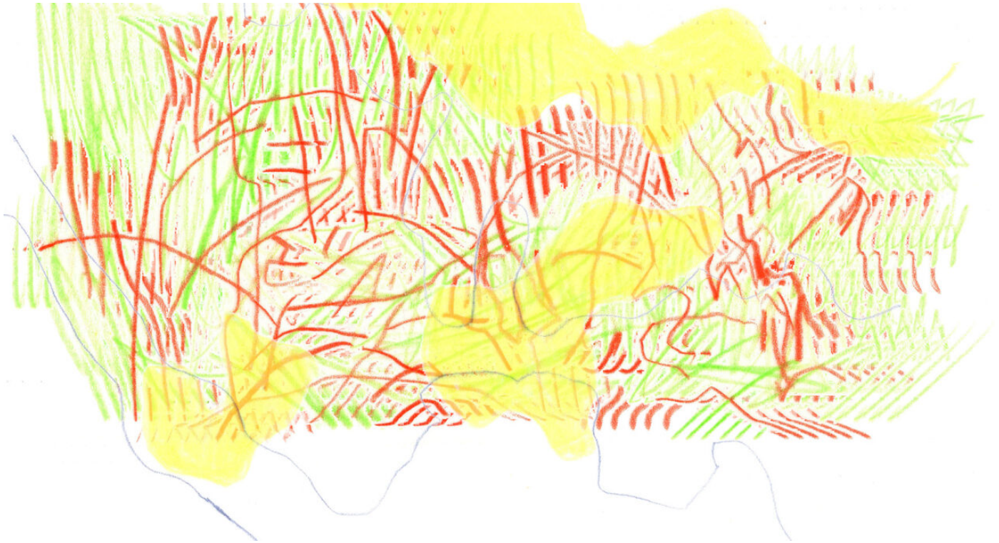
L'hypothèse biomimétique // Moé Muramatsu / Topophile