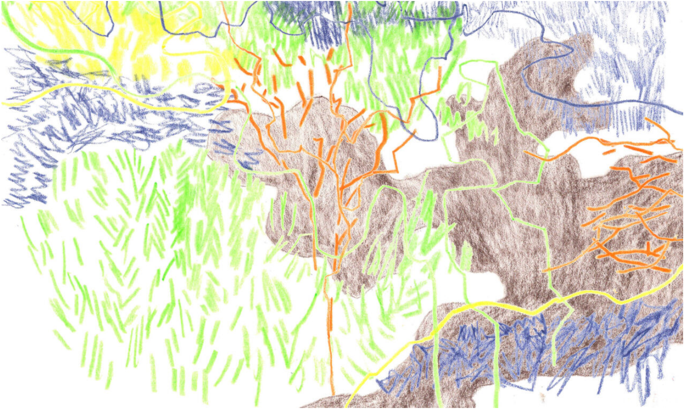
L'hypothèse biomimétique // Moé Muramatsu / Topophile