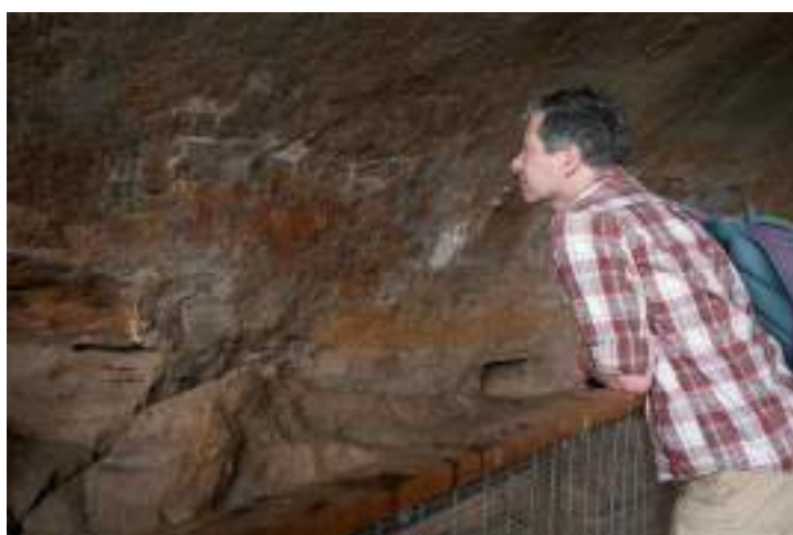
Photo 6 : visite du site de Wonderwerk Cave, mars 2022.