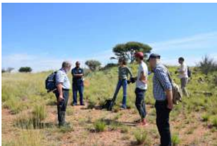
Photo 2 : membres de l'équipe sur le site de Wildebeest Kuil, Platfontein, mars 2022.

formes et dynamiques de mise en tourisme et de médiation, 3. questionner les formes de vulnérabilité perçues par les différents acteurs parties prenantes. In fine , selon un axe transversal, le projet vise à intégrer l'ensemble des données collectées dans un système d'information géographique (SIG) permettant de produire des cartes couplant usages/ valeurs/ formes de valorisation/ vulnérabilité. Documents de synthèse, ces cartes fonctionnent comme un outil d'aide à la décision dans la mise en place de plans de gestion intégrant les différents types de rapports et de perceptions en lien avec les sites d'art rupestre.