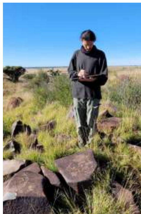
Photo 10 : inventaire des roches gravées de Wildebeest Kuil, Platfontein, avril 2022.