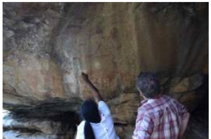
Photo 1 : deux membres de l'équipe devant Ghost Shelter, ferme d'Omandumba, massif de l'Erongo, avril 2022.

D'un point de vue théorique, le projet COSMO-ART mobilise l'approche cosmopolitique, appropriée compte tenu de la dimension pluriverselle de la notion de patrimoine. L'approche cosmopolitique se définit comme une posture de recherche, qui reconnaît de facto qu'il existe différentes manières de percevoir ce qui, présentement, fait patrimoine. Selon une démarche empirique, cette approche vise à interroger ce qui a du sens pour les différentes parties prenantes impliquées dans la patrimonialisation des sites d'art rupestre. À partir des valeurs identifiées, cette approche vise ensuite à reconnaître des points de contacts, des passerelles entre