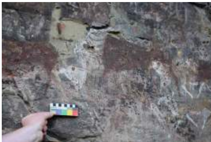
Photo 4 : évolution du site de Utheckwane, massif du Drakensberg, mars 2022.