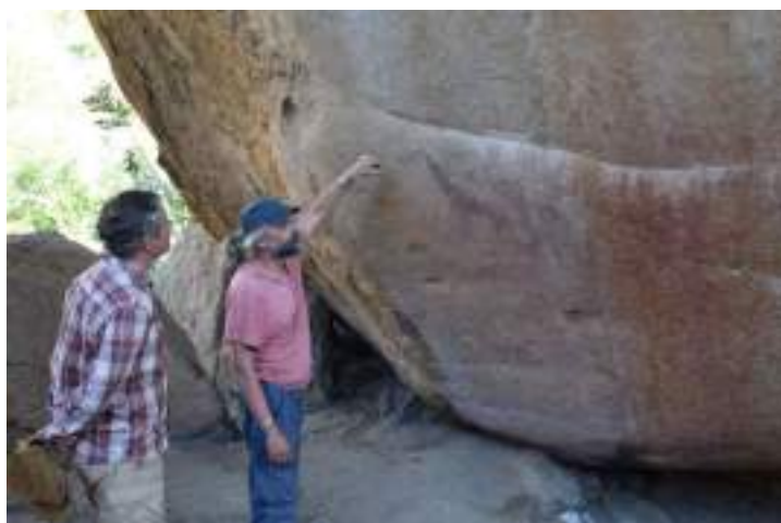
Photo 7 : visite du site de Fackelträger, ferme d'Omandumba, massif de l'Erongo, avril 2022.

au déroulé des actions prévues sur 2023 avec le National Heritage Council . Puis, avec l'arrivée de David Pleurdeau, direction les sites du massif de l'Erongo, avec les visites des sites d'art rupestre sur deux fermes (Etemba, Omandumba) et ceux gérés par la communauté à Spitzkoppe. Même s'il reste encore beaucoup à organiser, les principaux éléments sont cadrés pour assurer un bon déroulé des actions de recherche prévues en Namibie à compter de 2023.