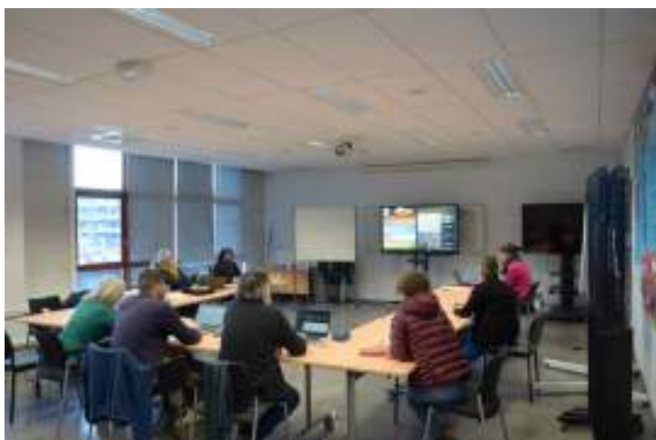
Photo 3 : séminaire de lancement de COSMO-ART, Bourget-du-Lac, janvier 2022.

Intégrant des chercheurs mais également des membres d'institutions patrimoniales (musées, organismes de