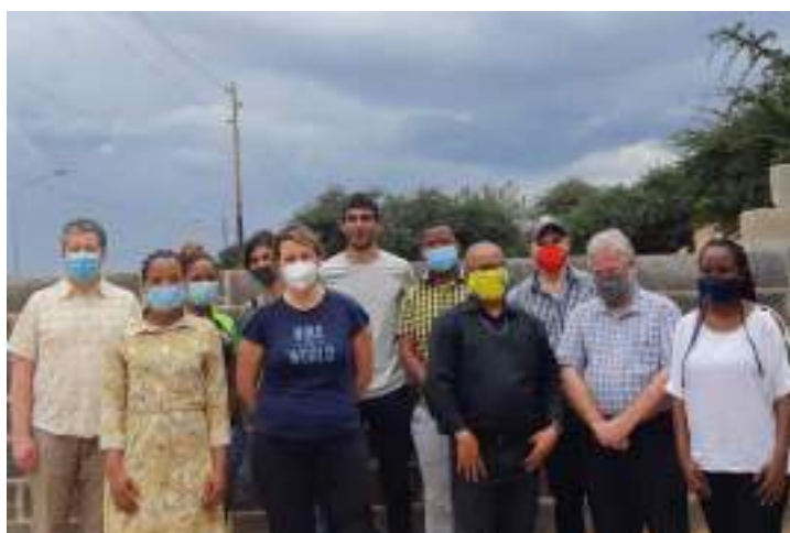
Photo 5 : présentation du projet aux membres de SASDO, Southern African San Development Organisation, Platefontein, mars 2022.