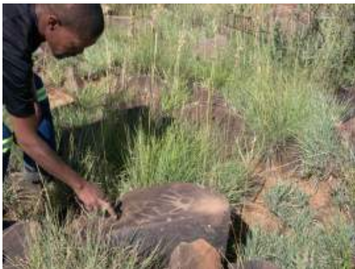
Photo 8 : avec un guide sur le site de Wildebeest Kuil, Platfontein, mai 2022.

entrevues avec un groupe de jeunes des deux communautés. Des visites dans différents départements du Northern Cape ( Department of Economic Development And Tourism, Department of Sports Arts and Culture, Department of Social Development, Northern Cape Tourism Authority ) m'ont permis d'évaluer les enjeux financiers et marketing du site. Elles ont montré la pertinence d'une série d'entretiens auprès des touristes du Big Hole afin de mieux comprendre les enjeux et multiples difficultés du développement touristique du Wildebeest Kuil Rock Art Centre (réalisés avec un étudiant de Archeology Studies de Sol Plaatje University ). Un séjour d'une semaine à Cape Town s'est avéré nécessaire afin de rencontrer divers membres de South African Heritage Resources Agency (SAHRA). Ce fut une opportunité pour aller voir le centre culturel !Khwa ttu , où un certain nombre de jeunes de Platfontein ont reçu une formation de guides, ainsi qu'une occasion parfaite pour échanger avec plusieurs chercheurs de l' University of Cape Town . Également, trois jours entre Upington et Twee Rivieren m'ont permis d'engager une réflexion étayée sur le projet de création du Khomani San Exhibition Centre , notamment en rencontrant des membres du South African San Council .