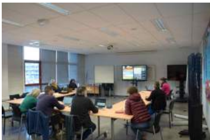
Photo 3 : séminaire de lancement de COSMO-ART, Bourget-du-Lac, janvier 2022.

Intégrant des chercheurs mais également des membres d'institutions patrimoniales (musées, organismes de