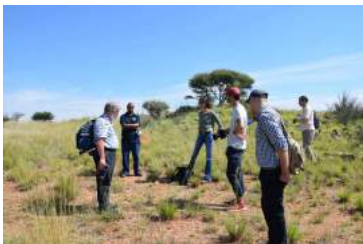
Photo 2 : membres de l'équipe sur le site de Wildebeest Kuil, Platfontein, mars 2022.

formes et dynamiques de mise en tourisme et de médiation, 3. questionner les formes de vulnérabilité perçues par les différents acteurs parties prenantes. In fine , selon un axe transversal, le projet vise à intégrer l'ensemble des données collectées dans un système d'information géographique (SIG) permettant de produire des cartes couplant usages/ valeurs/ formes de valorisation/ vulnérabilité. Documents de synthèse, ces cartes fonctionnent comme un outil d'aide à la décision dans la mise en place de plans de gestion intégrant les différents types de rapports et de perceptions en lien avec les sites d'art rupestre.