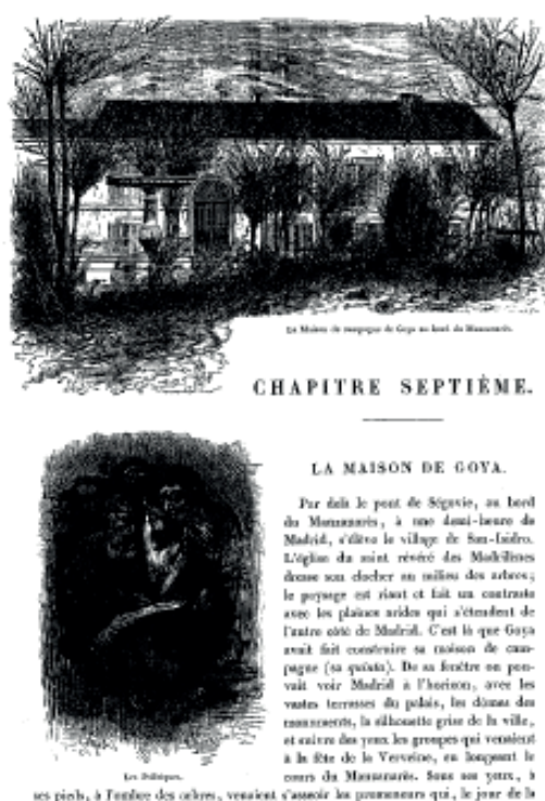
Fig. 1. Chapitre d'Yriarte dédié à la « Maison du Sourd » et à ses fresques 12

En un temps où les moyens techniques n'autorisaient encore que rarement les reproductions des œuvres à investir l'espace textuel, le public n'avait au mieux pu voir que quelques unes des gravures de Goya. L'impact d'une telle innovation était donc considérable et autorisait l'auteur à affirmer : « le but spécial de l'ouvrage que nous présentons au public est de faire connaître le Goya peintre 13 ».