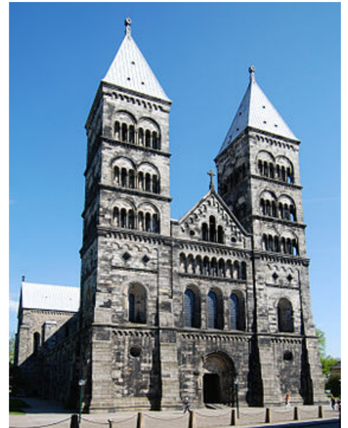
Cathédrale de Lund