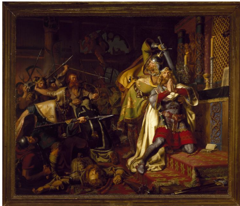
Christian Albrecht von Benzon, Knud den Helliges død (1843)