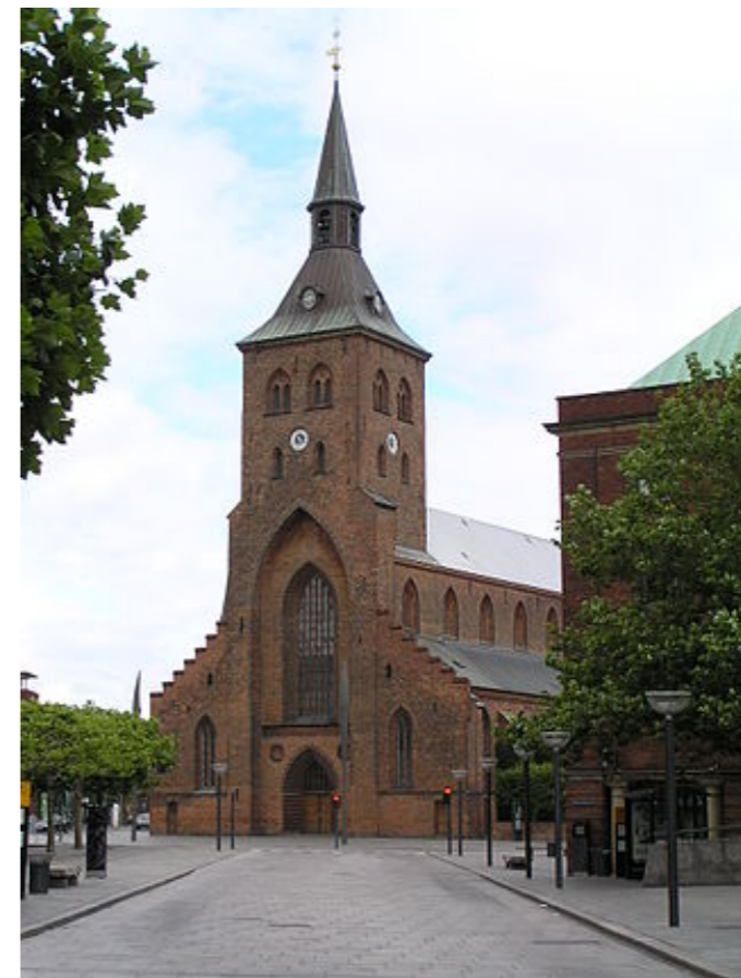
Cathédrale Saint-Knut (Odense)