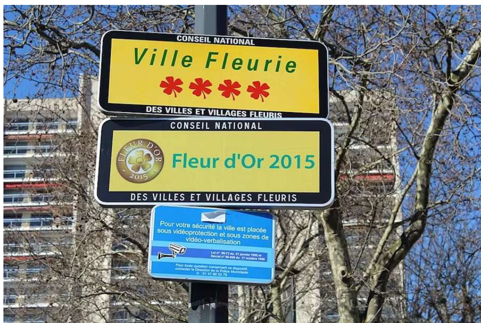
Panneau « Ville fleurie » avec 3 fleurs à Courbevoie près du pont de Levallois (Hauts-de-Seine).

Enseignant-chercheur INSEEC Grande Ecole, Chercheur associée au LAREFI, Université de Bordeaux