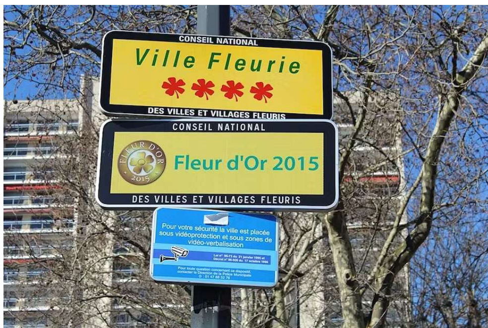
Panneau « Ville fleurie » avec 3 fleurs à Courbevoie près du pont de Levallois (Hauts-de-Seine).

Enseignant-chercheur INSEEC Grande Ecole, Chercheur associée au LAREFI, Université de Bordeaux