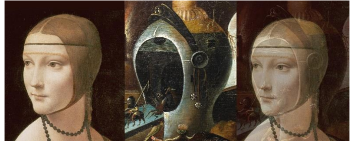
Caterina Sforza, l'amazone qui combattit en armure, épée à la main, les armées de la toute puissante et redoutable famille des Borgia !

culture scientifique était vaste et diversifiée, et le langage des recettes s'est avéré utile dans divers contextes, y compris le débat de la Renaissance sur les femmes. En 1600, Moderata Fonte, dans son dialogue, Il Merito delle donne 17 , opposera l'efficacité et la franchise de certaines recettes médicinales et cosmétiques – capables de guérir la maladie ou de transformer l'apparence – à la tâche impossible de trouver une recette pour enseigner aux hommes à respecter les femmes comme leurs égales 18 .