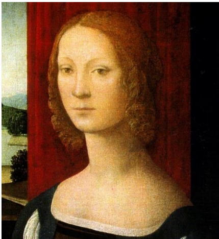
Portrait de Caterina Sforza par Lorenzo di Credi

Xavier d'Hérouville 1 & Aurore Caulier 2