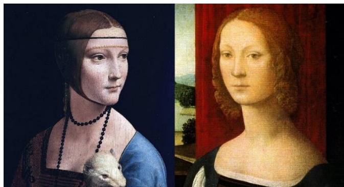
La Dame à l'hermine est... Caterina Sforza ?

En 1495, le roi de France, Louis XII, allié au pape Alexandre VI 13 - qui a succédé trois ans auparavant à Innocent VIII - décide de déclarer la guerre aux États italiens. Il conquiert d'abord le Duché de Milan tandis que le Pape revendique les domaines de la Romagne pour Cesare Borgia, « le Valentino » son fils. Ce que l'indomptable Caterina Sforza n'est évidemment pas disposée à accepter. Caterina Sforza s'applique immédiatement à étoffer ses troupes, améliorer l'armement et entreposer de grandes quantités de provisions et de munitions en prévision d'un éventuel siège mené par les troupes commandées par César Borgia, duc de Valentinois et fils du pape. Elle renforce aussi les défenses de ses forteresses, notamment celle de Ravaldino, où elle réside.