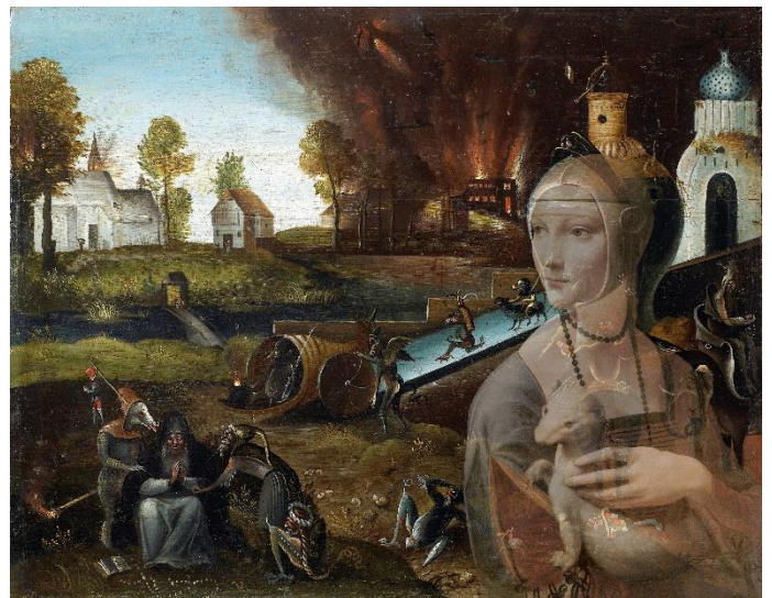
Superposition et transparence de la Dame à l'hermine et du Grand Œuvre de Leonardo 19