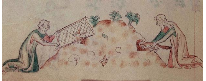
Femmes chassant le lapin au furet dans le Psautier de la Reine Marie 7

Milan, et de sa maîtresse la comtesse Lucrezia Landriani. Caterina Sforza a été élevée par sa grand-mère paternelle Bianca Maria Visconti dans la cour animée et raffinée des grands poètes et écrivains de la Renaissance italienne. Cette dernière ainsi que son père, lui ont transmis leur passion pour la guerre et la chasse et lui ont appris l'art de gouverner 6 .