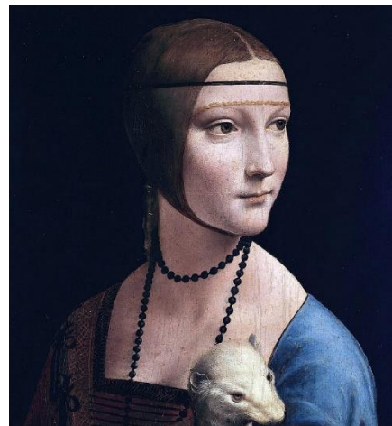
La Dame à l'hermine par Léonard de Vinci

Cette « hermine » - qui est en réalité un furet albinos - est un exemple ancien de furet de compagnie, dont la visibilité de la robe était particulièrement prisée pour la chasse au lapin 8