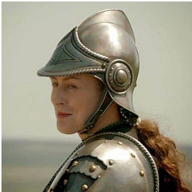
Caterina Sforza incarnée à l'écran par Gina McKee 11

et de Forlì. À la mort de son époux, assassiné en 1488 par les partisans du nouveau pape, Innocent VIII 10 , elle est conduite à exercer la régence au nom de son fils Ottaviano, encore mineur. En parfaite stratège formée à l'exécutif, elle commence par baisser les impôts et à sceller des alliances avec des États voisins par les unions contractées pour ses fils. Qui plus est, portée par son penchant naturel pour l'armée, en authentique condottiere, elle prend en charge la formation militaire de ses troupes.