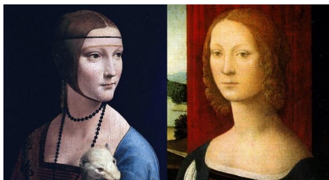
La Dame à l'hermine est... Caterina Sforza ?

En 1495, le roi de France, Louis XII, allié au pape Alexandre VI 13 - qui a succédé trois ans auparavant à Innocent VIII - décide de déclarer la guerre aux États italiens. Il conquiert d'abord le Duché de Milan tandis que le Pape revendique les domaines de la Romagne pour Cesare Borgia, « le Valentino » son fils. Ce que l'indomptable Caterina Sforza n'est évidemment pas disposée à accepter. Caterina Sforza s'applique immédiatement à étoffer ses troupes, améliorer l'armement et entreposer de grandes quantités de provisions et de munitions en prévision d'un éventuel siège mené par les troupes commandées par César Borgia, duc de Valentinois et fils du pape. Elle renforce aussi les défenses de ses forteresses, notamment celle de Ravaldino, où elle réside.