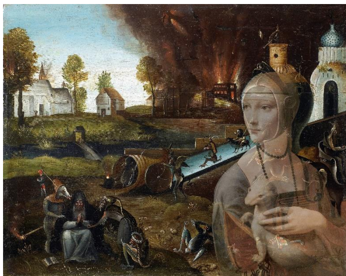
Superposition et transparence de la Dame à l'hermine et du Grand Œuvre de Leonardo 19