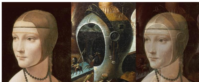
Caterina Sforza, l'amazone qui combattit en armure, épée à la main, les armées de la toute puissante et redoutable famille des Borgia !

culture scientifique était vaste et diversifiée, et le langage des recettes s'est avéré utile dans divers contextes, y compris le débat de la Renaissance sur les femmes. En 1600, Moderata Fonte, dans son dialogue, Il Merito delle donne 17 , opposera l'efficacité et la franchise de certaines recettes médicinales et cosmétiques – capables de guérir la maladie ou de transformer l'apparence – à la tâche impossible de trouver une recette pour enseigner aux hommes à respecter les femmes comme leurs égales 18 .