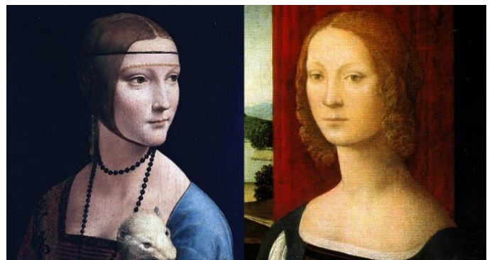
La Dame à l'hermine est... Caterina Sforza ?

En 1495, le roi de France, Louis XII, allié au pape Alexandre VI 13 - qui a succédé trois ans auparavant à Innocent VIII - décide de déclarer la guerre aux États italiens. Il conquiert d'abord le Duché de Milan tandis que le Pape revendique les domaines de la Romagne pour Cesare Borgia, « le Valentino » son fils. Ce que l'indomptable Caterina Sforza n'est évidemment pas disposée à accepter. Caterina Sforza s'applique immédiatement à étoffer ses troupes, améliorer l'armement et entreposer de grandes quantités de provisions et de munitions en prévision d'un éventuel siège mené par les troupes commandées par César Borgia, duc de Valentinois et fils du pape. Elle renforce aussi les défenses de ses forteresses, notamment celle de Ravaldino, où elle réside.