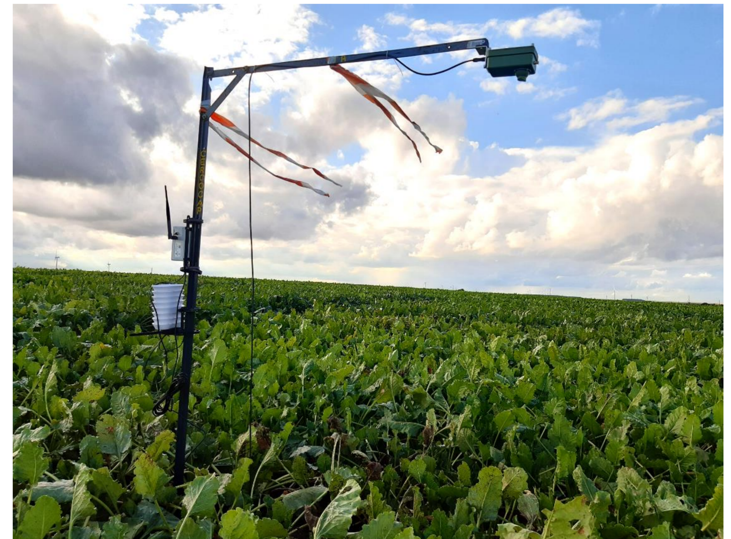
Fig.1 : caméra connectée installée au champ

Un travail d'optimisation de l'échelle d'annotation par eye-tracking 1 a été mené pour faciliter l'étape manuelle de labellisation nécessaire à l'entraînement des algorithmes de deep learning de type Unet.