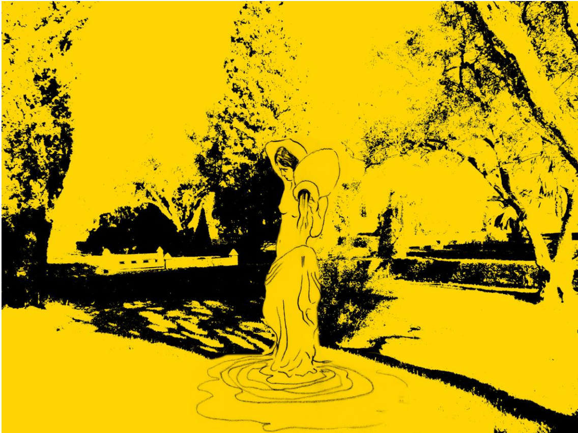
Figure 2. « [...] une très jolie fontaine en faïence de couleur, figurée par une femme grandeur nature portant une cruche sur l'épaule d'où coulait l'eau, recueillie à ses pieds, dans une vasque de forme ovale » Création visuelle Didier Tallagrand