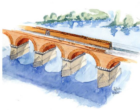
Figure 3. Dessins de Christian Darles, d'après les travaux de Badié et Gassend