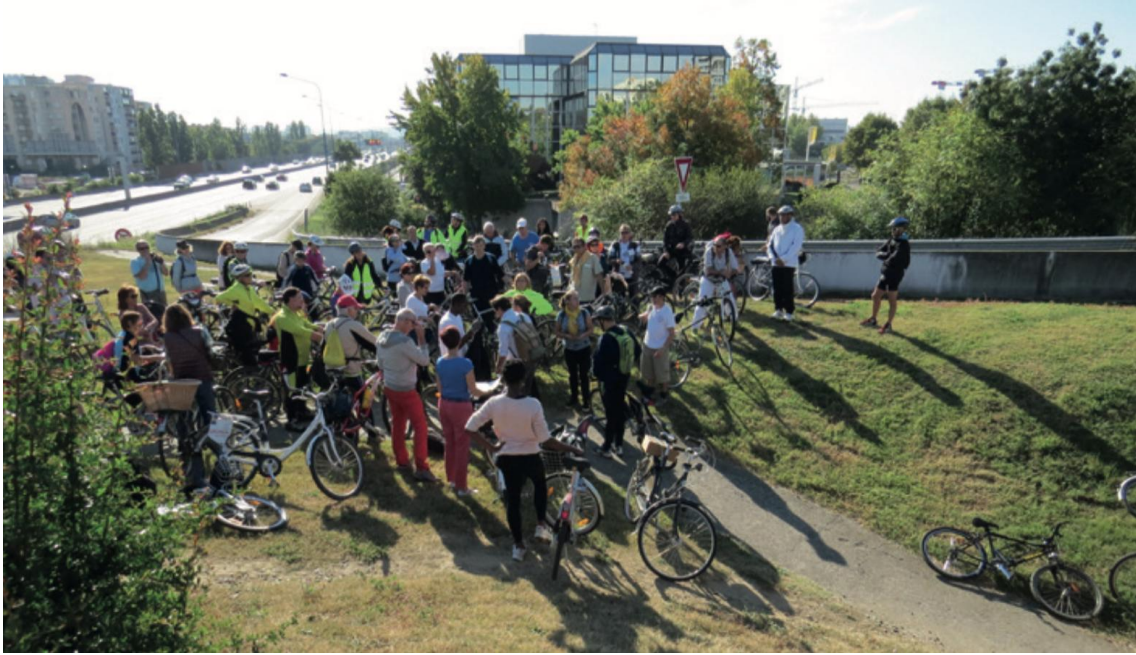
Figure 4. En suivant le tracé de l'aqueduc (randonnée métropolitaine du 11 octobre 2015).