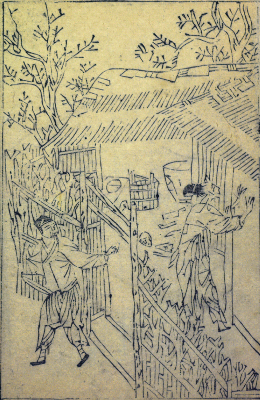
Fig. 17: YANG Dongming, « Meurtre d'une fillette de deux ans », Jimin tushuo , 1-32b.