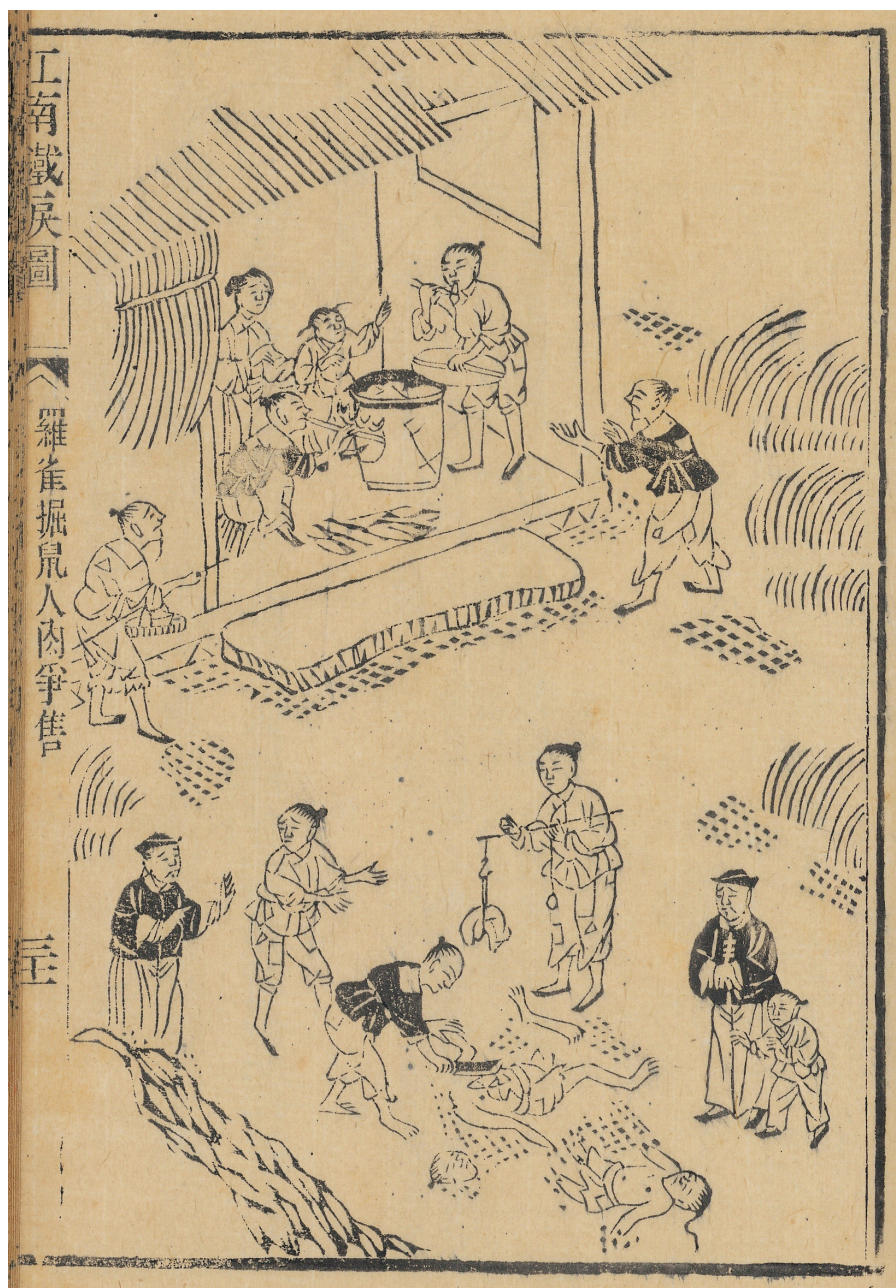
Fig. 15: JIYUN Shanren, « Ils cherchent par tous les moyens à se procurer de quoi survivre, ils se disputent pour vendre de la chair humaine », Jiangnan tielei tu , 1864.