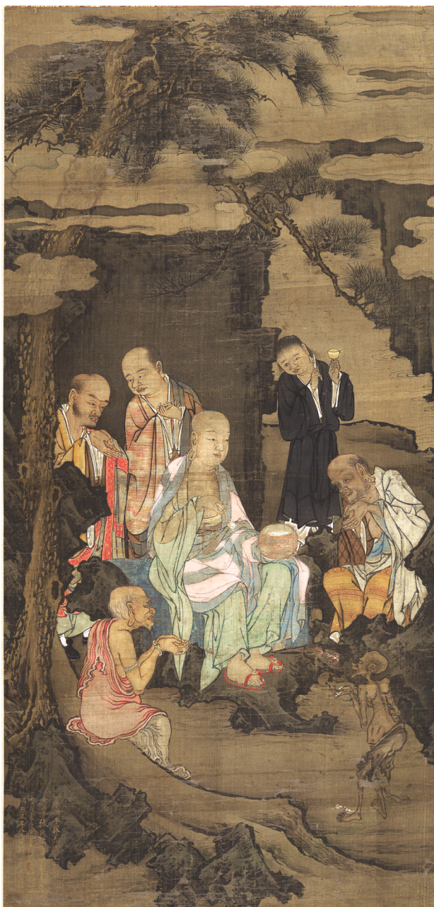
Fig. 5: LIN Tinggui 林庭珪 (actif vers 1160-1180), Arhats donnant à manger à un esprit affamé, 1178. Rouleau vertical, encre et couleurs sur soie, 111,4 × 53 cm.