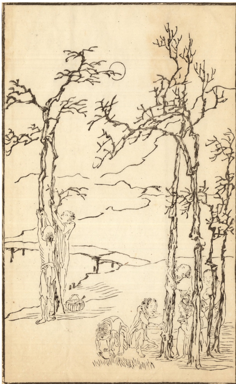
Fig. 3: QIAN Hui'an, Sans titre , dans Qin ji tushuo , vers 1878, n° 8.