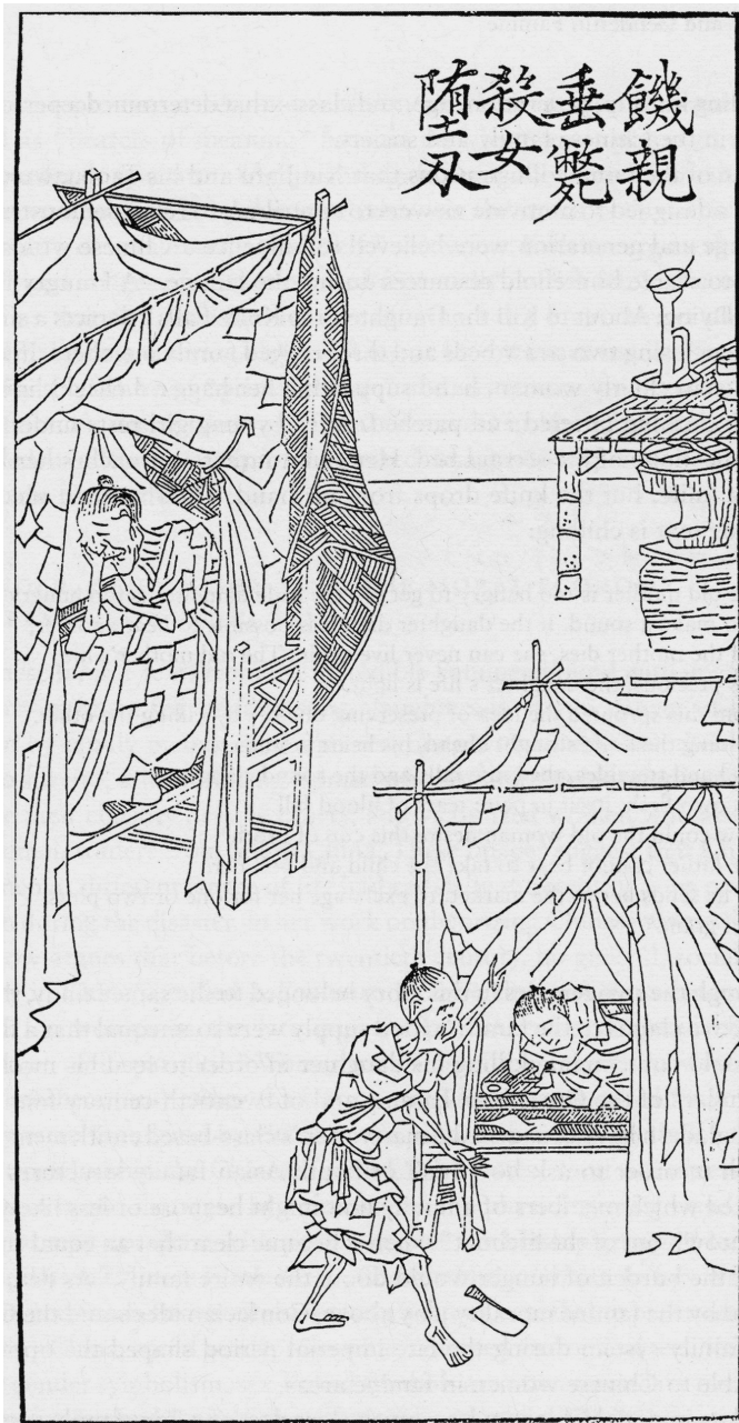
Fig. 9: TIAN Zilin, « Sur le point de tuer sa fille pour nourrir sa mère mourante, il laisse tomber son couteau », Zhongzhou fuyou tu , [1879] 1881.