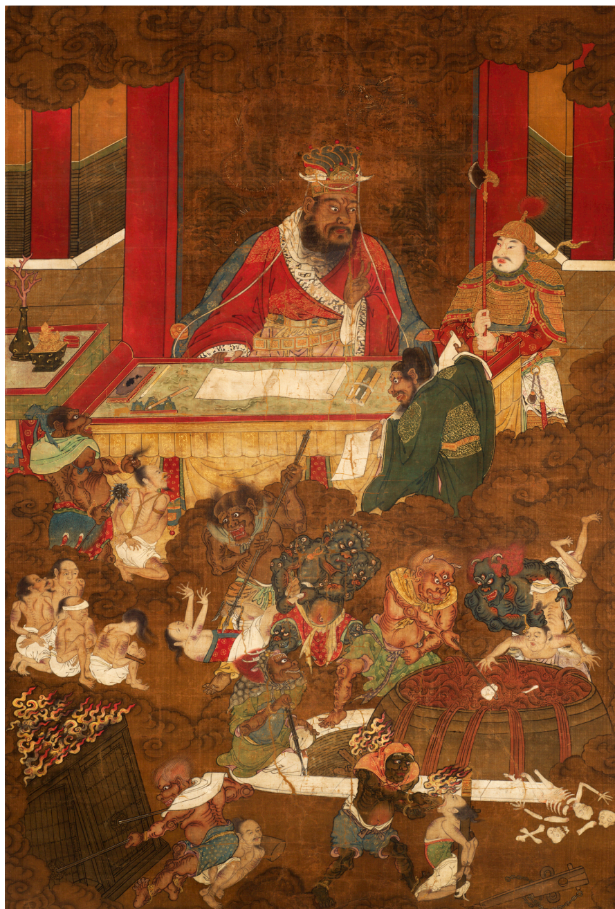
Fig. 14a : ANONYME, Roi des enfers , époque Ming (xv e siècle - xvi e siècle). Rouleau vertical, encre et couleurs sur soie, 140,1 × 94,3 cm.