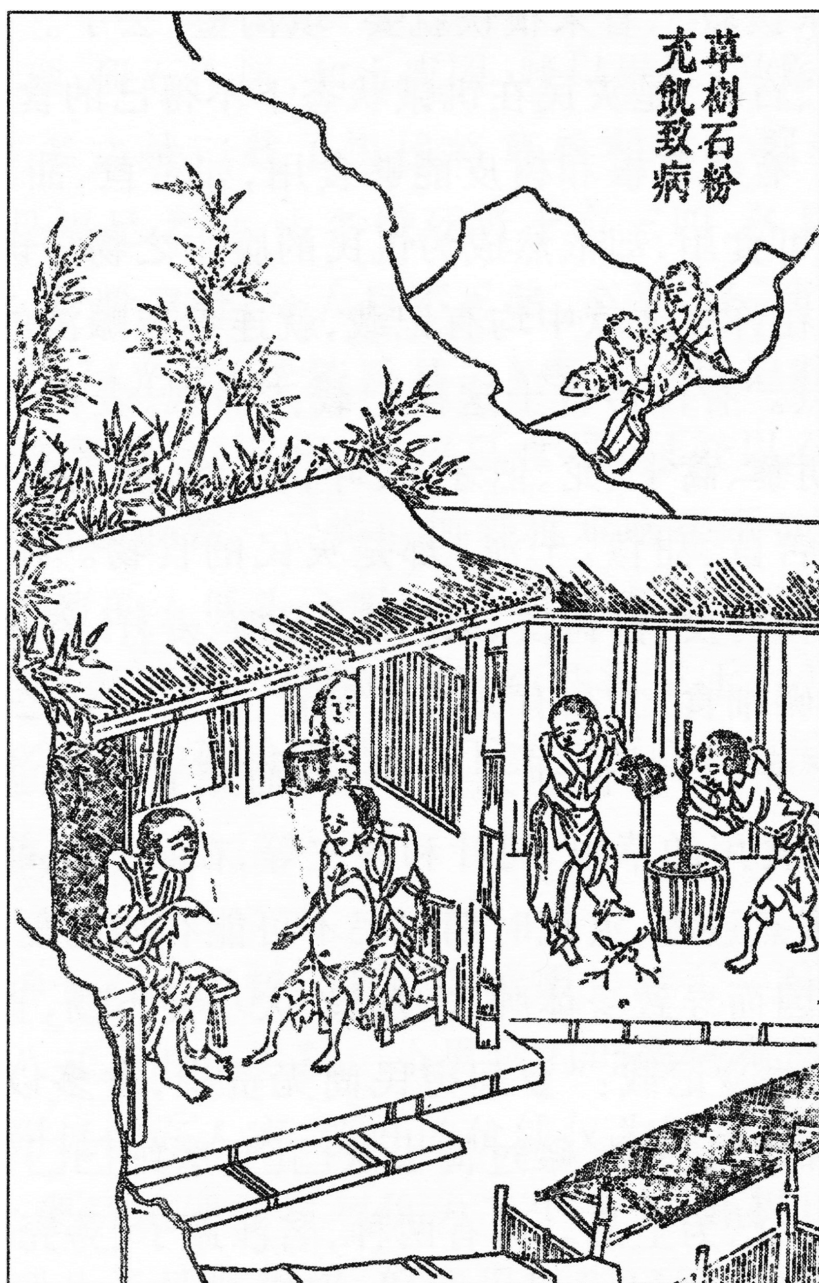
Fig. 4 : TIAN Zilin, « Les herbes mélangées à de la terre rassient les affamés mais leur causent des maladies », Jin zai leijin tu , 1879, n° 2.

Source : Bibliothèque nationale de Chine (XD10128).