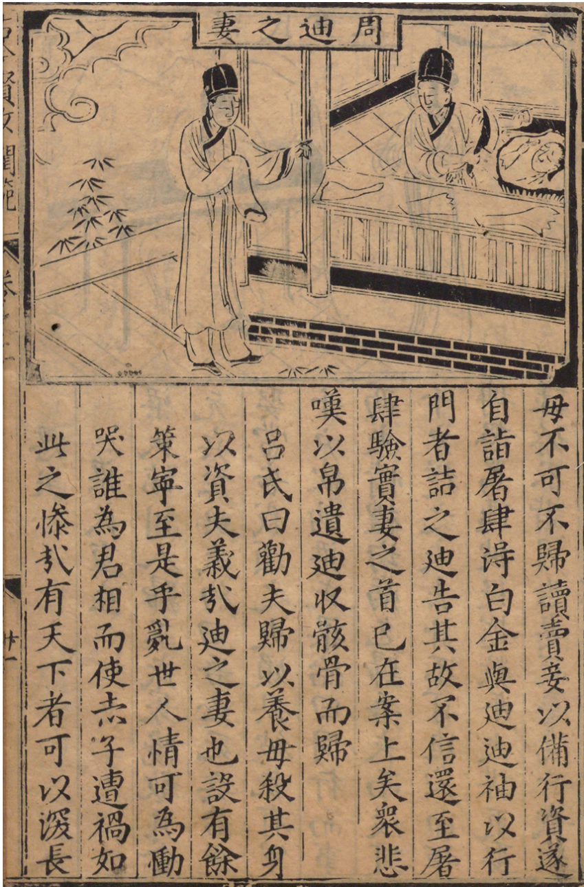
Fig. 16: Lǚ Kun, « La femme de Zhou Di », Guifan si juan 閩範四卷.

Édition du Baoshan tang 寶善堂, 1596, 3/31a.