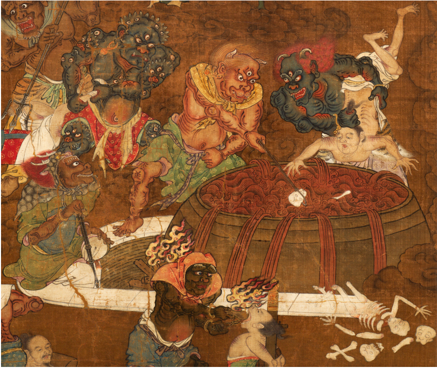
Fig. 14b : ANONYME, Roi des enfers (détail), époque Ming (xv e siècle-xvii e siècle). Rouleau vertical, encre et couleurs sur soie, 140,1 × 94,3 cm.

Si aucune de nos gravures ne représente aussi clairement le corps de la victime en train de bouillir, une partie d'entre elles évoque à la fois sa découpe, sa mise en vente, sa cuisson et sa consommation. Il en est ainsi dans « Ils cherchent par tous les moyens à se procurer de quoi survivre, ils se disputent pour vendre de la chair humaine », du Jiangnan tielei tu [Fig. 15] qui inclut au premier plan une scène de boucherie figurant la mise en pièce de deux corps et leur vente à un homme en haillons, sous le regard de deux fonctionnaires dont un semble vouloir empêcher la transaction. À l'arrière-plan, la scène se poursuit à l'intérieur d'une maison dans laquelle différents membres d'un foyer se pressent autour d'une marmite : l'un d'entre eux l'oxygène, tandis qu'un autre porte à la bouche un petit morceau de nourriture difficilement identifiable. Si la séquence narrative de l'avant-plan à l'arrière-plan ne laisse aucun doute quant à la nature du repas, celui-ci pourrait paraître à première vue « ordinaire », le corps de la