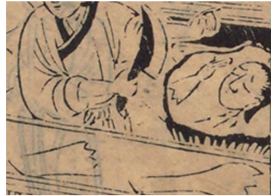
Fig. 19 : Lü Kun, « La femme de Zhou Di » (détail), Guifan si juan .

La scène représentée se passe chez le malfaiteur [Fig. 17] [Fig. 18]. La tête coupée de la fillette et ses membres désolidarisés sont dispersés sur le sol de la cuisine, à proximité d'un grand couteau, détails qui ne sont pas sans rappeler l'illustration du Guifan de 1596 [Fig. 19].