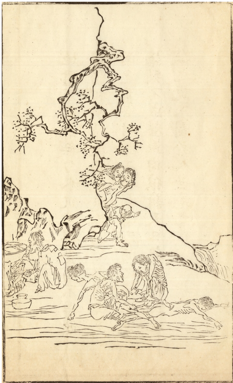
Fig. 13: QIAN Hui'an, Sans titre, Qin ji tushuo , n° 6, vers 1878.