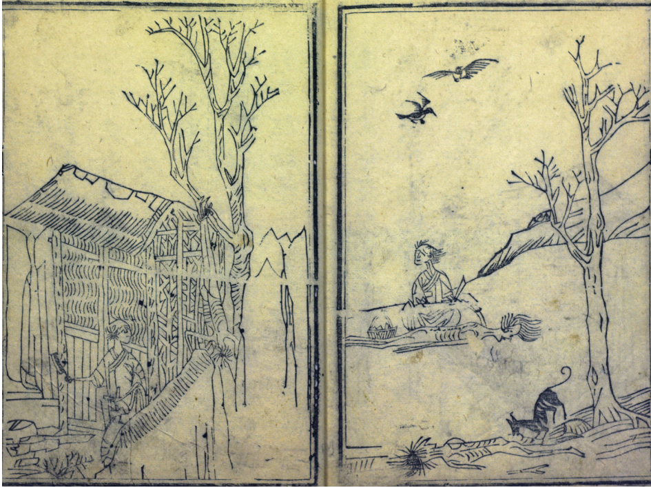
Fig. 6: YANG Dongming, « Coupant et mangeant de la chair humaine », Jimin tushuo , [1594] 1748, 28b-29a.

Lorsqu'ils ont mangé toutes les racines d'herbes et les écorces d'arbre, ils se regardent les uns les autres les yeux grands ouverts, sans pouvoir trouver des moyens de survie, ils se résignent alors à couper la peau et la chair des corps amaigris des morts de faim ; ils emploient du fumier comme combustible et les font bouillir dans des casseroles, [ils les mangent] sans se soucier qu'ils soient crus ou cuits, songeant seulement à calmer leur faim du moment. La chair humaine n'est pas un aliment sain, quelques jours après l'avoir consommée, les yeux se font rouges et les cœurs chauds, on y perd également la vie [...] 21 .