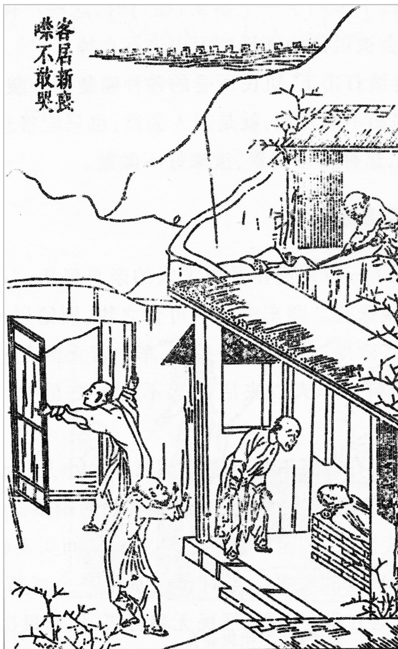
Fig. 12: TIAN Zilin, « Décédée en terre étrangère, on n'ose pas la pleurer », Jinzai leijin tu , 1879.