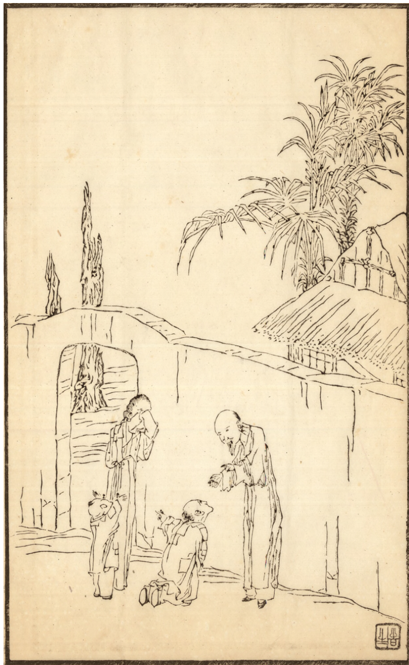
Fig. 11 : QIAN Hui'an, Sans titre, Qin ji tushuo , n° 9, vers 1878.