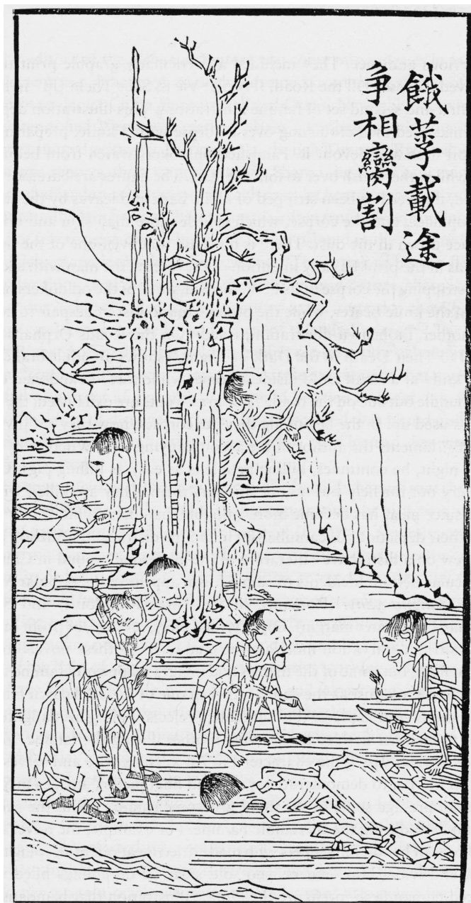
Fig. 7: TIAN Zilin, « Les cadavres des affamés jonchent les routes, [les survivants] se disputent pour les couper en morceaux », Yuji tielei tu , [1879], 1881.