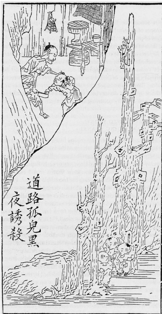
Fig. 8: TIAN Zilin, « Les orphelins sur les routes sont attirés par la ruse et tués dans la nuit sombre », Zhongzhou fuyou tu , [1879], 1881.