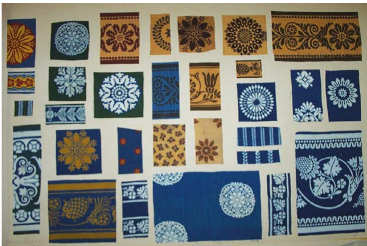
Échantillons de meubles à ornements Album Feray, volume 1 p. 47 (M.T.J. inv.000.4.36)

Au même moment, ce nouveau procédé de teinture est aussi employé dans la création d'un nouveau genre de « meubles à ornements dans différentes nuances [...] ». Ces meubles remplacent parfaitement les soieries de Lyon et la garniture de tout un fauteuil n'emploie qu'une aune 7/8 l'aune étant 6f en \frac{3}{4} et 6f50 en \frac{7}{8} » dont « la mode en a pris très fortement en France & les personnes les plus riches ne dédaignent pas de s'en meubler. 24 » L'impression à l'enlavage favorise la fabrication de ces nouveaux meubles qui déclinent motifs de rosaces, pomme de pin, enroulements d'acanthé en différentes tailles, reprenant les formes répandues dans la décoration des intérieurs.