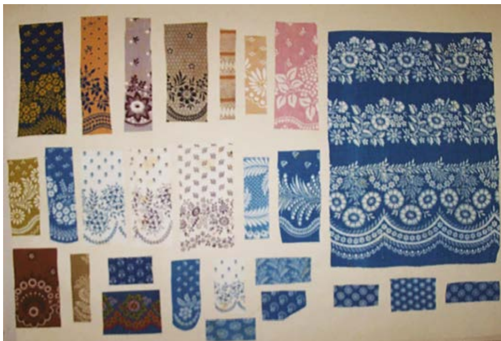
Échantillons de Bayadères Album Feray volume 1, p. 55 (M.T.J. inv.000.4.36)

Pendant longtemps, l'impression à l'enlavage fut appliquée à des motifs déjà répandus dans les toiles peintes, mais en 1817, cette méthode de teinture est appliquée à la fabrication d'un « genre nouveau très distingué. C'était une invention de M. Jules [Mallet] 21 , composée de charmants dessins enluminés, divisés en lés au moyen de larges bandes horizontales assorties au dessin pour former une bordure au bas de la robe. On leur donna le nom de Bayadères , emprunté d'un opéra nouveau » 22 . Ces toiles peintes dont les motifs s'inspirent de la dentelle sont imprimées en rubans de différentes largeurs pour agrémenter les toilettes ou bien sous forme de robes. En 1818, les motifs bayadères , déclinés en motifs et en coloris variés, forment une partie importante des impressions pour le vêtement, « ce genre est le plus en usage parmi les femmes les plus distinguées et à le plus grand succès on coud au bas des robes deux rangs de volants et l'on garnit les manches et le corsage de petits volants et de petites bordures 23 . »