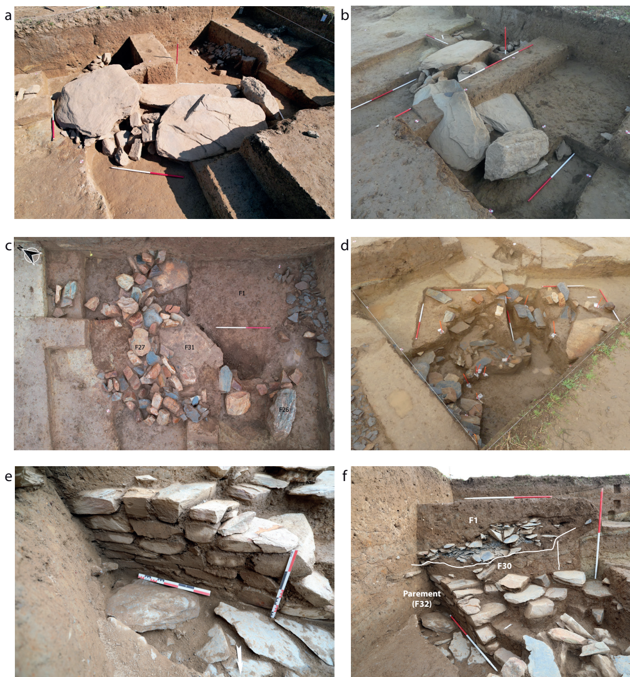
Fig. 2 – Vue des tombes en cours de fouilles : a-b , le coffre à dalles F26 depuis le sud et l'ouest ; c , le tas de pierres en arc de cercle (F27) après démontage du coffre F26 ; d , vue depuis l'est de la fosse centrale F30 ; e , vue du parement sud (F32) ; f , vue de la coupe NE-SO montrant le puits de fouilles F1, la fosse centrale F30 et le parement sud (F32) de la tombe fouillée par P. du Chatellier (a, c, d & e : clichés C. Nicolas ; b, d, clichés : Y. Pailler).

des dalles en granite (F31) pourrait avoir servi de fond au coffre mais celle-ci étant désaxée, cela suggère que ce n'est pas sa fonction première. Entre cette dalle et le bloc de quartz (F26), deux pierres plates affleurant au même niveau semblent avoir complété imparfaitement ce dallage. Entre les dalles, l'ensemble des terres est apparu largement remanié, composé de limon brun et de limon gris oxydé meubles, résultat de terriers et de fouilles anciennes. Sous la plus grande dalle du coffre, un petit tesson de faïence jaune a d'ailleurs été mis au jour.