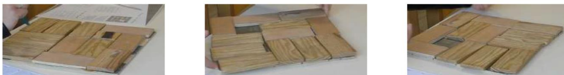
Fig. 5 : Preuve de l'existence d'un pavage en utilisant des considérations géométriques (rotations)

Concernant les cases où il était impossible d'exhiber un pavage nous avons vu deux postures d'élève différentes. La première, l'élève accepte le fait qu'il n'existe pas de solution et sait qu'il ne l'a pas prouvé. Dans la deuxième posture, l'élève refuse la situation d'impossibilité et n'envisage à aucun moment l'inexistence d'un tel pavage. Nous constatons ci-après que l'élève est en train de (re)déplacer des dominos pour essayer d'exhiber absolument un pavage de cette région (Fig.6).