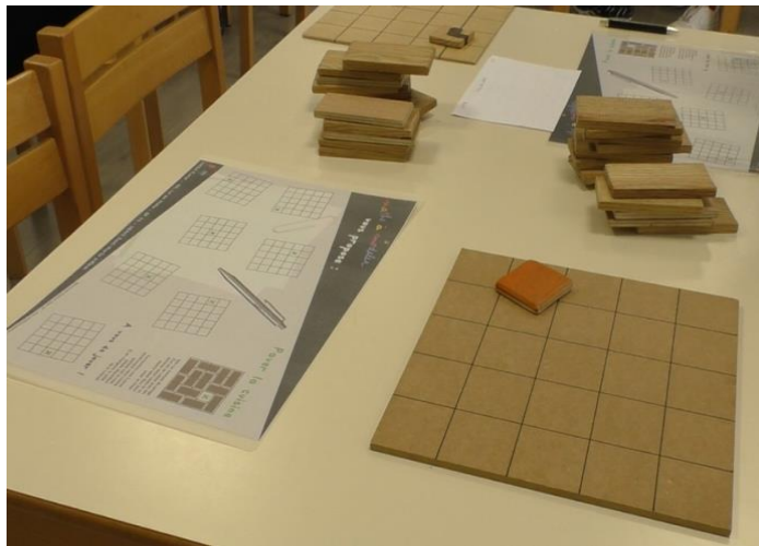
Fig. 2 : Ensemble du matériel à disposition des élèves

Pour répondre, d'une part au problème instancié sur le cas particulier d'une grille de taille 5 \times 5 et d'autre part, élaborer des pistes pour la résolution dans le cas général 4 d'une grille de taille n \times n , nous disposons d'un ensemble d'artefacts manipulables : un plateau sous forme de grille de taille 5 \times 5 , de dominos 1 \times 2 et d'un unomino pour représenter la case laissée libre (Fig.2).