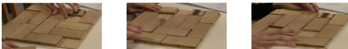
Fig. 6 : L'élève essaye absolument de paver pour cette configuration sans y parvenir

Concernant les cases où il était impossible d'exhiber un pavage nous avons vu deux postures d'élève différentes. La première, l'élève accepte le fait qu'il n'existe pas de solution et sait qu'il ne l'a pas prouvé. Dans la deuxième posture, l'élève refuse la situation d'impossibilité et n'envisage à aucun moment l'inexistence d'un tel pavage. Nous constatons ci-après que l'élève est en train de (re)déplacer des dominos pour essayer d'exhiber absolument un pavage de cette région (Fig.6).