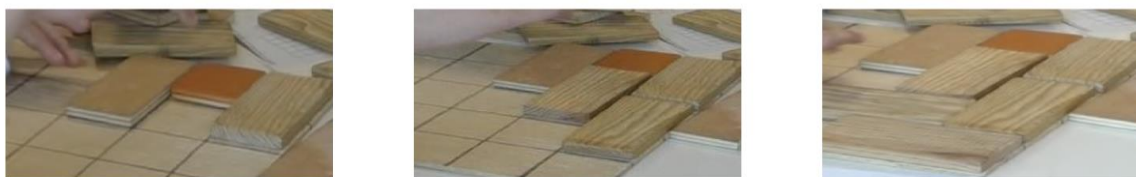
Fig. 7 : Début d'un raisonnement de type forçage (absurde) non abouti

D'autres stratégies utilisant un raisonnement par conditions nécessaires (forçage) ont également émergé de l'analyse vidéo. Cependant, la plupart étaient incomplètes et ne permettaient pas tout à fait de conclure sur la « non pavabilité » de la grille (Fig.7).