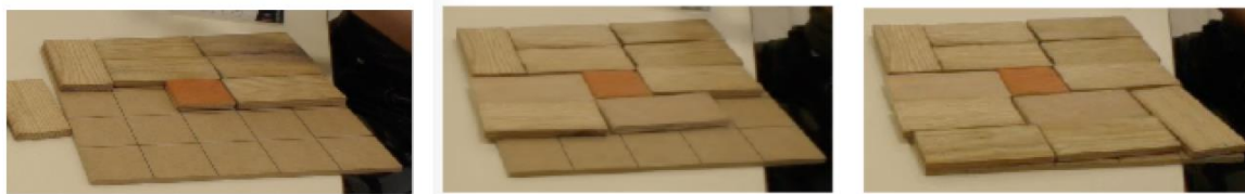
Fig. 4 : Preuve de l'existence d'un pavage pour ce positionnement du trou

Il n'a pas été surprenant au vu de notre analyse a priori de voir l'influence et l'engagement imminent dans la résolution du problème que propose cette situation. Les élèves ont essayé de paver suivant les positions du trou données sur le panneau (Fig.1). Tous les élèves sont arrivés à prouver l'existence d'un pavage pour certaines positions de la case laissée libre, soit en l'exhibant (Fig.4), soit en effectuant des rotations de la grille déjà pavée afin d'atteindre de nouvelles configurations (Fig.5).