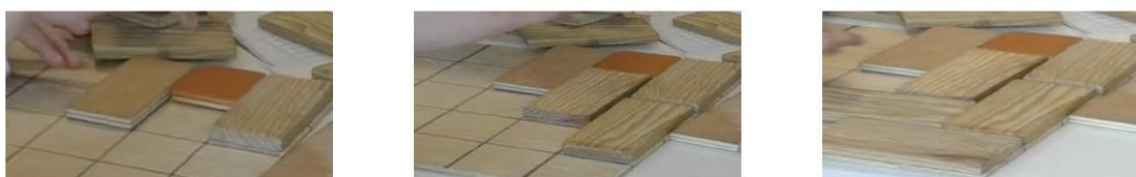
Fig. 7 : Début d'un raisonnement de type forçage (absurde) non abouti

D'autres stratégies utilisant un raisonnement par conditions nécessaires (forçage) ont également émergé de l'analyse vidéo. Cependant, la plupart étaient incomplètes et ne permettaient pas tout à fait de conclure sur la « non pavabilité » de la grille (Fig.7).