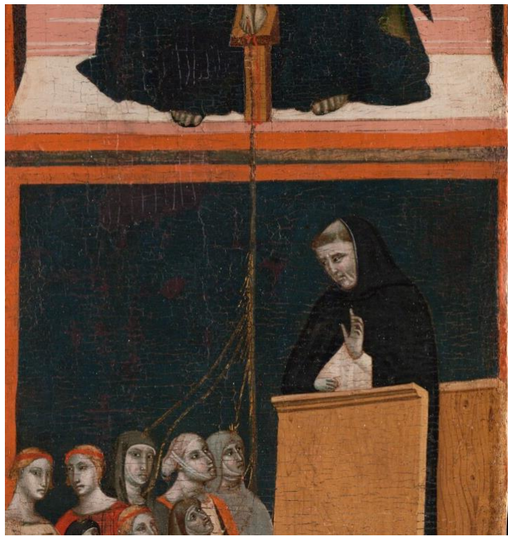
Figure 12 : Pacino di Bonaguida, Tabernacle Chiarito , détail du volet droit.

ornementations de la partie centrale, la transformant ainsi en une image mouvante et insaisissable 16 . Après l'union mystique et l'union eucharistique, l'union de la communauté au Christ est déclinée sur le volet droit du retable (fig. 11). On y voit dans le registre supérieur la Trinité sous la forme d'un Trône de grâce. Ce motif iconographique montrant dans un même temps la Trinité, la paternité de Dieu et l'offrande du Fils par le Père relie ce volet droit aux deux autres volets du retable via le thème du sacrifice. Dans le registre inférieur du panneau, un groupe de fidèles écoute un prédicateur dominicain en chaire. On y voit des hommes et des femmes dont certaines portent un habit religieux. Au pied de la chaire, Chiarito, légèrement en retrait et de plus petite taille que les autres personnages, observe la scène : il s'agit donc encore d'une scène de vision. L'auditoire est dans l'ensemble très attentif au prêche.