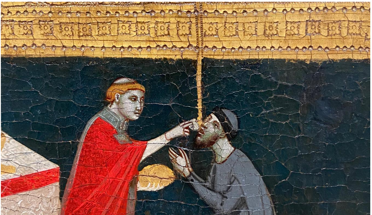
Figure 10 : Pacino di Bonaguida, Tabernacle Chiarito , détail du panneau central. On voit bien comment le rayon doré provenant de la partie supérieure du panneau est au point de contact entre l'hostie consacrée et la bouche du visionnaire.

La partie inférieure présente les deux visions de Chiarito dont nous avons parlé précédemment (fig. 4, fig. 5 et fig. 6) : à gauche, des épis de blés jaillissent de l'hostie élevée ; à droite, un Christ blanc les bras en croix est placé sous les rayons qui joignent l'hostie élevée et le visionnaire, anticipant l'ingestion de l'hostie consacrée par ce dernier. Derrière Chiarito, une bête s'aplatit au sol en courbant la tête face à la puissance de l'Eucharistie. Entre les deux scènes, Chiarito reçoit l'hostie dans la bouche des mains