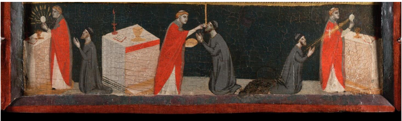
Couverture: Pacino di Bonaguida, Tabernacle Chiarito , tempera, gesso et or sur panneau, c. 1340, 101,3 x 113,5 cm, Getty Museum, Los Angeles, détail du panneau central.

Mots clés : peinture, Moyen Âge, Florence, commande, vision, or, médiation