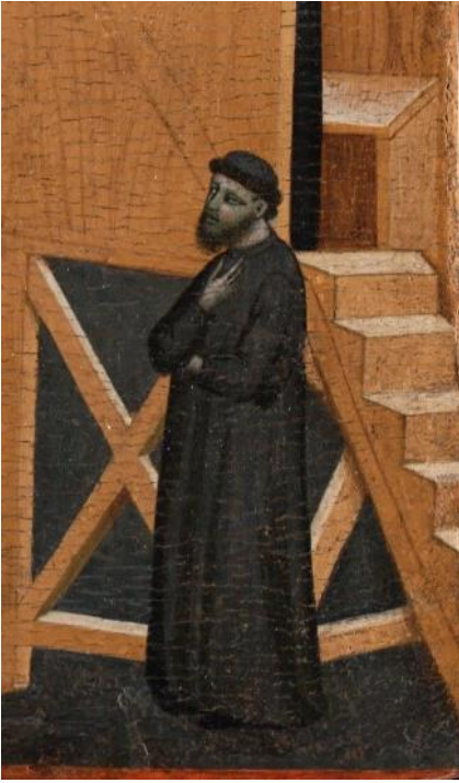
Figure 4 : Pacino di Bonaguida, Tabernacle Chiarito , détail du volet droit. Le vêtement de Chiarito correspond à la description donnée dans sa vita .

forme était souligné par l'absence de col, de manche et de ceinture 10 ». Le vêtement du laïc ici décrit est tout à fait semblable à ce que l'on observe dans l'image (fig. 4).