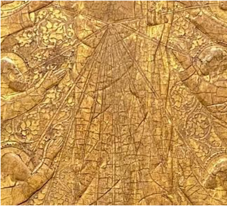
Figure 9 : Pacino di Bonaguida, Tabernacle Chiarito , détail du panneau central.

La partie inférieure présente les deux visions de Chiarito dont nous avons parlé précédemment (fig. 4, fig. 5 et fig. 6) : à gauche, des épis de blés jaillissent de l'hostie élevée ; à droite, un Christ blanc les bras en croix est placé sous les rayons qui joignent l'hostie élevée et le visionnaire, anticipant l'ingestion de l'hostie consacrée par ce dernier. Derrière Chiarito, une bête s'aplatit au sol en courbant la tête face à la puissance de l'Eucharistie. Entre les deux scènes, Chiarito reçoit l'hostie dans la bouche des mains