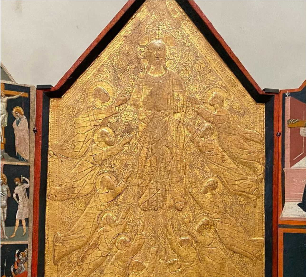
Figure 8 : Pacino di Bonaguida, Tabernacle Chiarito , détail du panneau central.

corps du Christ (fig. 9). Le treizième rayon traverse toute l'image dans sa hauteur jusqu'à la partie inférieure du panneau central, peinte et non dorée. Cette partie dorée est particulièrement travaillée et ornementée ce qui est assez inhabituel en ce début du xiv e siècle florentin où les fonds or sont bien moins ouvragés, y compris dans d'autres œuvres de l'atelier de Pacino di Bonaguida 15 .