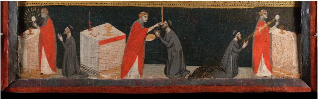
Figure 3 : Pacino di Bonaguida, Tabernacle Chiarito , détail du panneau central.

peut aller jusqu'à parler d' unicum car on ne connaît aucun autre exemple de cette iconographie en particulier, comme nous le verrons plus loin.