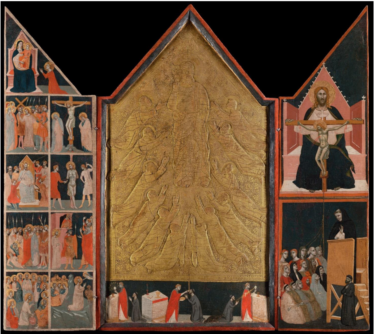
Figure 1 : Pacino di Bonaguida, Tabernacle Chiarito , tempera, gesso et or sur panneau, c. 1340, 101,3 x 113,5 cm, Getty Museum, Los Angeles.

Le tabernacle Chiarito de Pacino di Bonaguida est un objet tout à fait particulier et unique, qui pose un certain nombre de questions quant aux relations entre commande et iconographie (fig. 1).