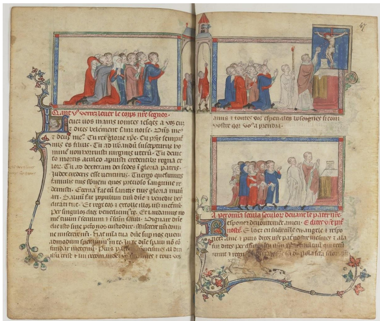
Source gallica.bnf.fr / Bibliothèque nationale de France. Département des Manuscrits. Français 13342

l'assemblée doit lever haut l'hostie consacrée pour inviter les fidèles à l'adorer. Il s'agit du moment le plus théâtral de la messe. Ce retable, ou tabernacle, est donc un objet qui sert de support à la fois