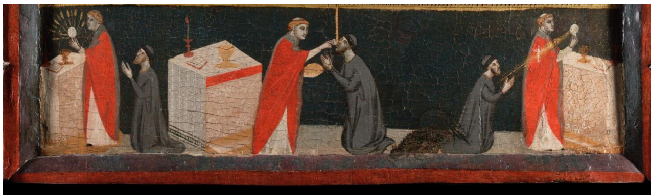
Couverture: Pacino di Bonaguida, Tabernacle Chiarito , tempera, gesso et or sur panneau, c. 1340, 101,3 x 113,5 cm, Getty Museum, Los Angeles, détail du panneau central.

Mots clés : peinture, Moyen Âge, Florence, commande, vision, or, médiation