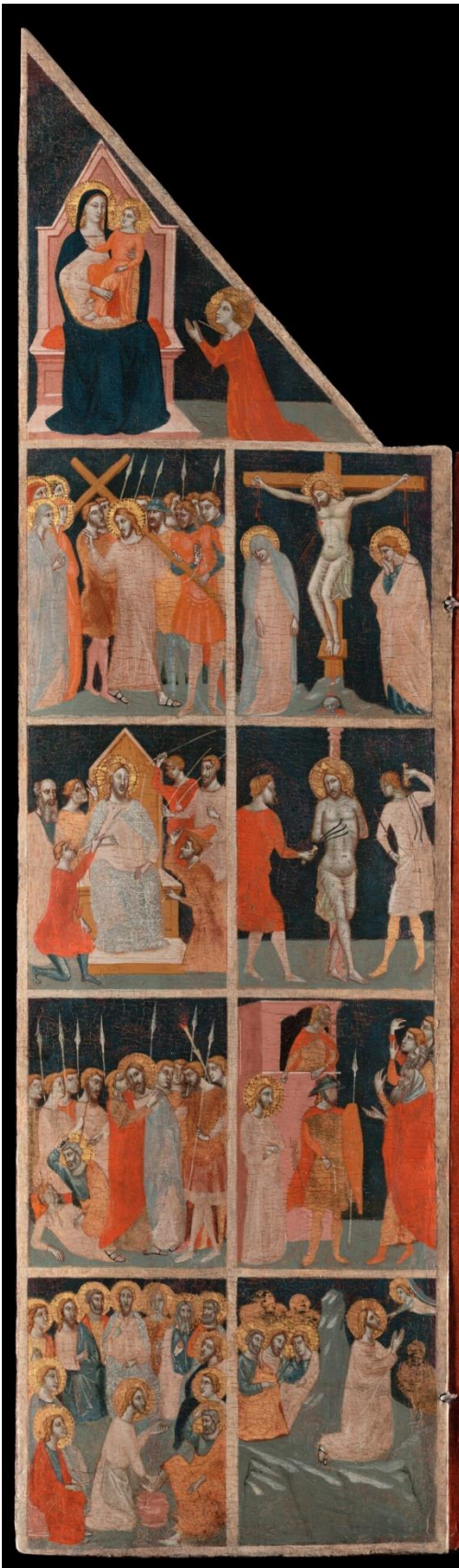
Figure 7 : Pacino di Bonaguida, Tabernacle Chiarito , volet gauche.

Regardons plus précisément l'image. Le volet gauche du triptyque représente la passion du Christ de façon caractéristique des retables florentins du xiv e siècle : l'ensemble est surmonté par le mariage mystique de saint Catherine (fig. 7). La présence de cette scène, motif iconographique courant dans la peinture du xiv e siècle, permet d'ancrer l'image qui est donnée de Chiarito dans l'histoire de l'Église grâce à un précédent illustre, celui de sainte Catherine d'Alexandrie. Cette assise historique, en tout cas hagiographique, permet de garantir la légitimité de Chiarito comme modèle et de l'intégrer dans la tradition de l'Église.